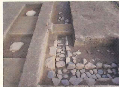
(僧坊推定建物の礎石と雨落ち溝)