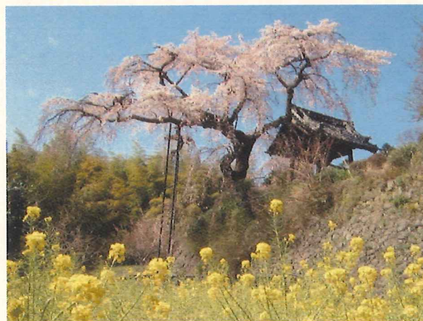
(京都府指定史跡名勝天然記念物 地蔵院のシダレザクラ)