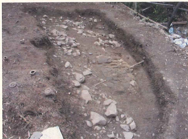
(史跡 大安寺旧境内附石橋瓦窯跡)