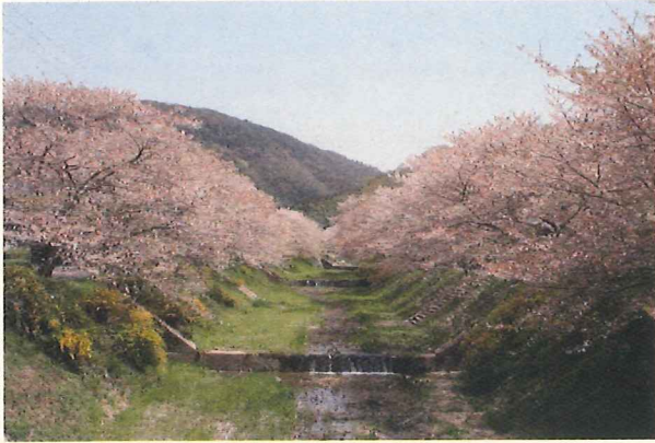
(井手町指定史跡・名勝天然記念物 井手玉川堤の山吹)