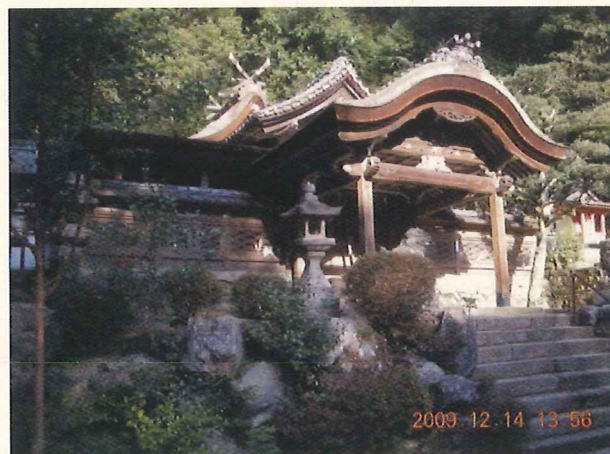
(京都府指定文化財 高神社本殿)