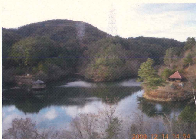
(京都府選定文化的景観 大正池とその水源かん養林)