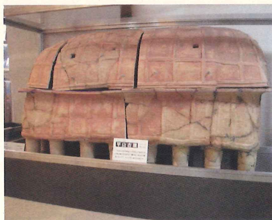
(井手町指定文化財 平山古墳出土陶棺)