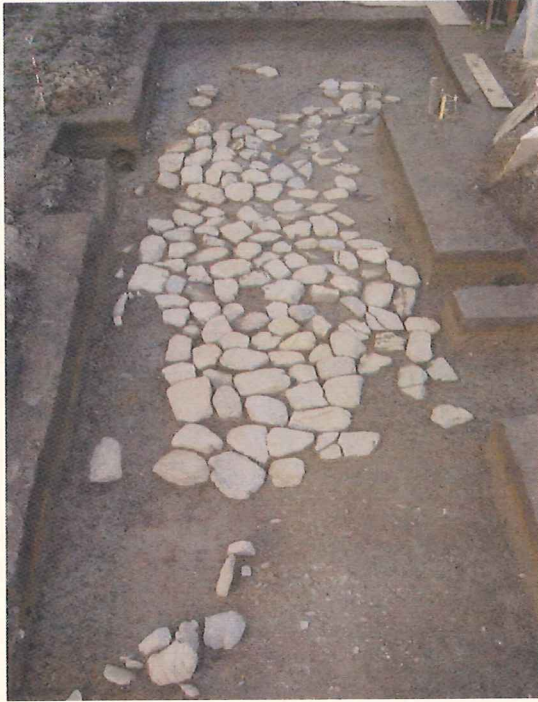
(井手寺跡の石敷き<石畳>)