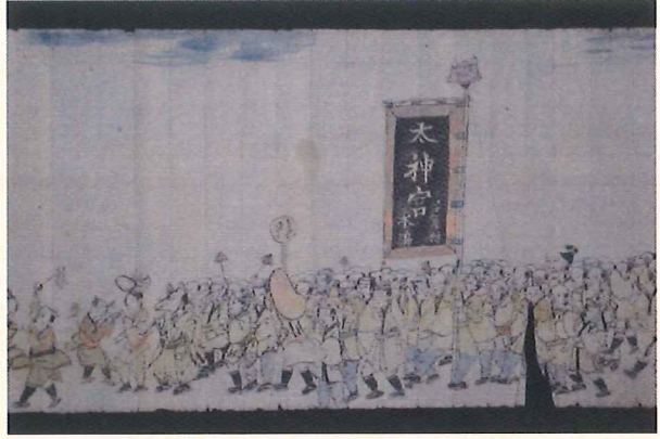
(井手町指定文化財・おかげ踊り絵図)