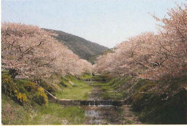
(井手町指定史跡・名勝天然記念物 井手玉川堤の山吹)