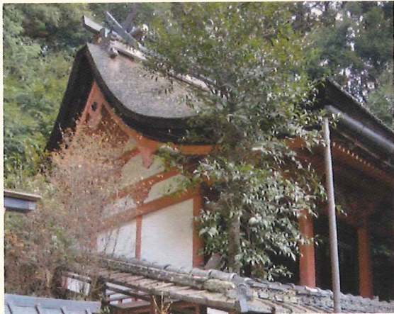
(京都府登録文化財 玉津岡神社本殿)