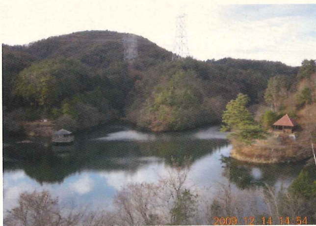
(京都府選定文化的景観 大正池とその水源かん養林)