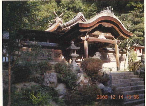
(京都府指定文化財 高神社本殿)