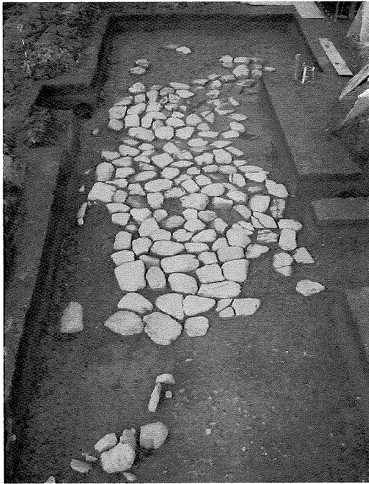
(井手寺跡の石敷き<石畳>)