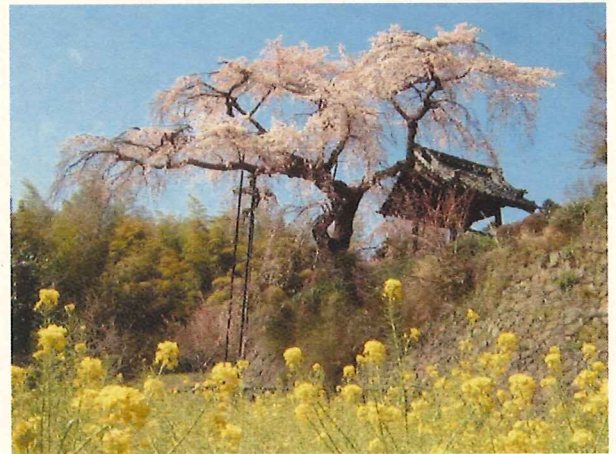
(京都府指定史跡名勝天然記念物 地蔵院のシダレザクラ)