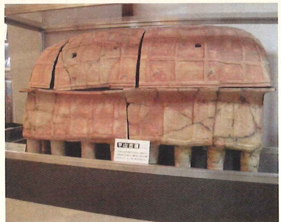
(井手町指定文化財 平山古墳出土陶棺)