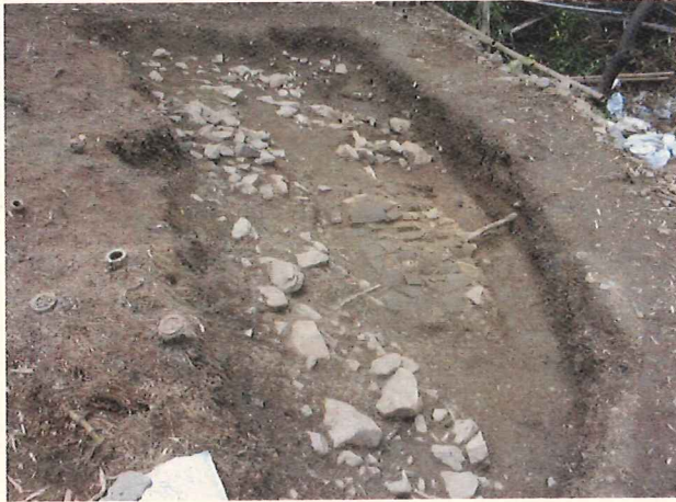
(史跡 大安寺旧境内附石橋瓦窯跡)