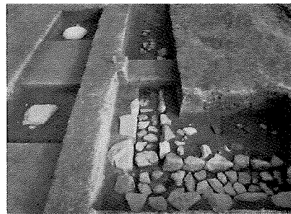
(僧坊推定建物の礎石と雨落ち溝)