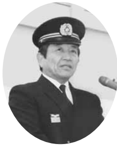
あいさつをする汐見町長