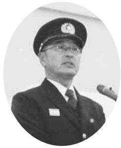
訓示を行う綱田団長