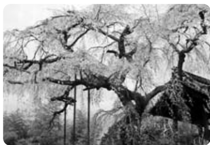
しなやかな枝に咲く地蔵禅院の「しだれ桜」

主な内容は、森林の現況と課題・目指すべき森林の姿（基本理念）・具体的方策、目標と計画に大別されています。とりわけ、目標については井手町の豊かな緑と清流は住民の豊かな生活環境と活力の源であり、住民参加による森林整備をはじめとした自然環境保全活動の活性化に努め、活動により生み出される資源を有効活用できる新しい循環型社会システムを実現していくとしています。