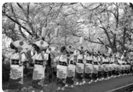
玉川堤にて披露されたおかげ踊り