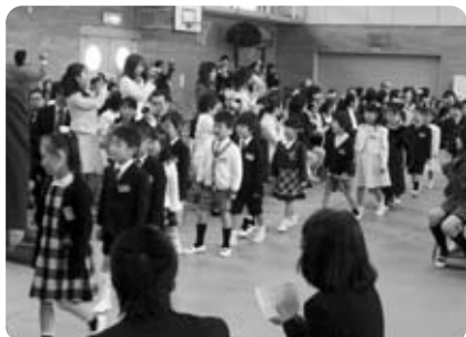
ドキドキ・ワクワクの1年生(井手小)