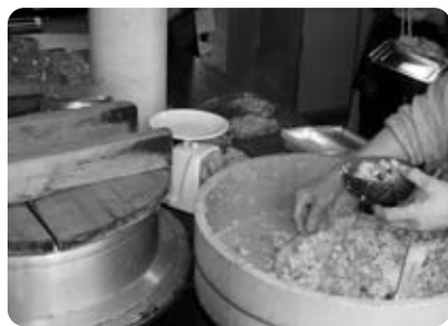
椿坂名物の「竹の子ご飯」