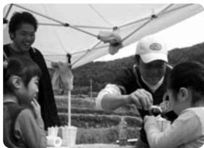
つつみ欲しくなる美味しさ