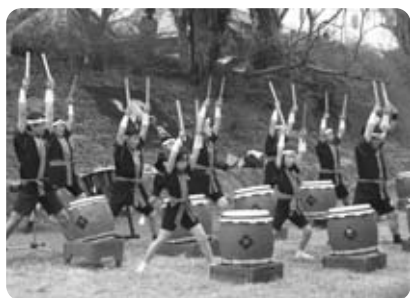
いづみ太鼓「左馬」による力強い和太鼓演奏