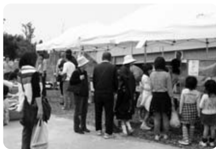
買い物客で賑わう模擬店