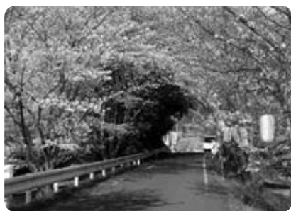
来場者を包み込む桜のトンネル