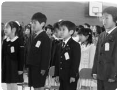
今日からピカピカの1年生(多賀小)

して、席に着いた新1年生は、担任の先生から自分の名前を呼ばれると『はい』と元気いっぱいのいい返事ができ、これから始まる新しい小学校生活の1日目がスタートしました。 今年度の新1年生は、井手小学校49人(男子28人・女子21人)、多賀小学校20人(男子8人、女子12人)が、ピカピカの1年生として迎えられます。