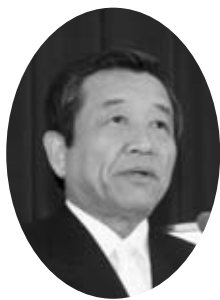
祝辞を述べる汐見町長