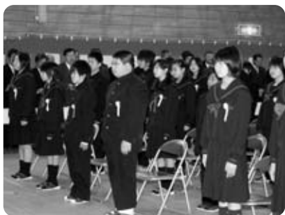
元気に校歌を斉唱する1年生(泉ヶ丘中)

今年度の新1年生は、68人(男子32人・女子36人)が泉ヶ丘中学校の1年生として迎えられました。