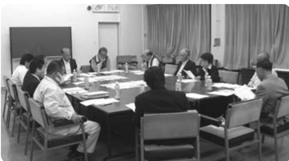
地域防災について検討する委員ら

今回は、現在までの取組報告、避難基準の検討、要配慮者(援護者)登録について事務局より説明があり、今後検討していくこととなりました。