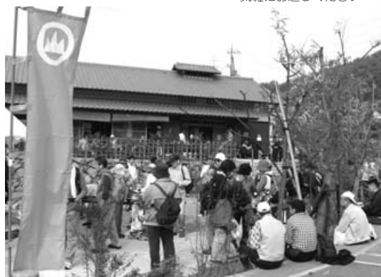
椿坂でくつろぐ参加者たち