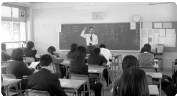
高校の授業を体験する生徒