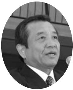
式辞を述べる汐見町長