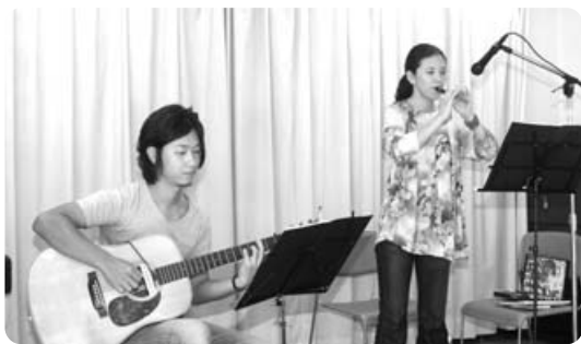
よし笛とギターの共演

よし笛は、「ヨシ」とよばれる植物を24センチほどの長さにしたもので、約2オクターブちかくの音階が出せます。演奏では、「もののけ姫」や「となりのトトロ」などを演奏。その澄み切った音色に参加者は、耳を傾けていました。