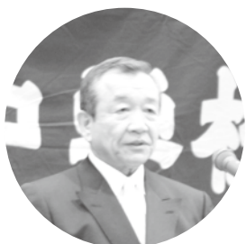
祝辞を述べる汐見町長