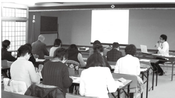
多賀地区の講座の様子

認知症という病気について理解することで、そこから接する上での心構えなどを学んだ。たくさんのご参加ありがとうございました！講座の終了時に、認知症サポーターの証となるオレンジリングをお渡しさせていただきました。