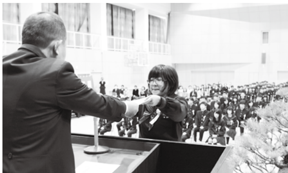
卒業証書を受け取る卒業生（泉ヶ丘中学校）

また3月20日には、井手小学校と多賀小学校で卒業証書授与式が行われ、井手小学校からは34人、多賀小学校からは15人が卒業しました。