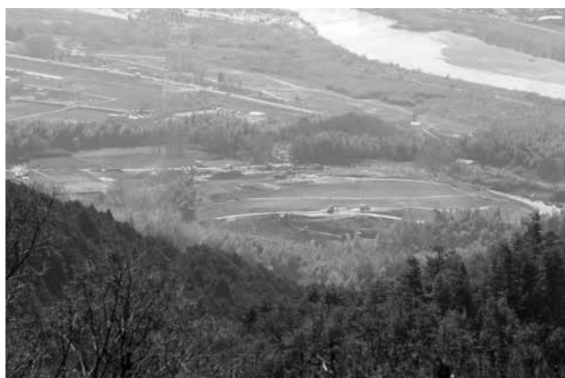
府立支援学校開設に向け登校路線を整備します