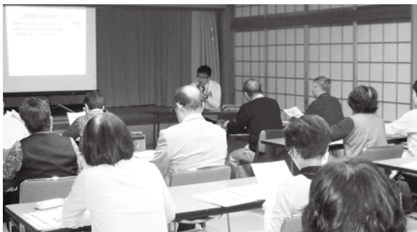
井手地区の講座の様子