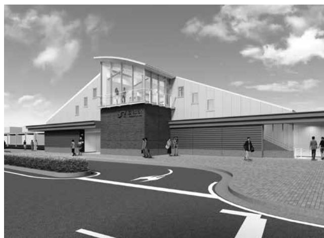
新しい JR 玉水駅外観のイメージ

その結果、一般会計予算は47億8000万円となり、前年度と比較して2億6100万円、5.8%の増額となりました。また、特別会計（国民健康保険・介護保険・後期高齢者医療・井手町水道事業・多賀地区簡易水道事業・公共下水道事業・多賀財産区）を合わせた予算総額は、74億7985万1千円（対前年度比△24万3千円、△0.0%）となりました。