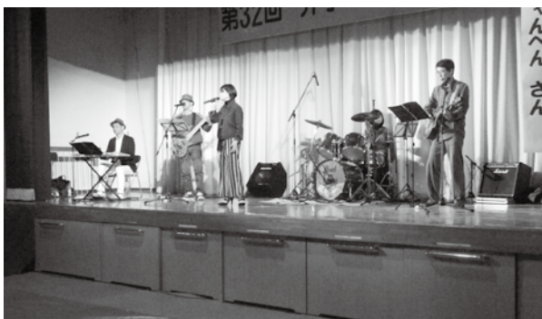
多彩な出し物が繰り広げられたステージ

差別を許さない人権意識の向上と、住民相互の交流を図ることを目的に、第32回井手町解放文化祭（同実行委員会主催）が3月11日（日）、いづみ人権交流センターといづみ