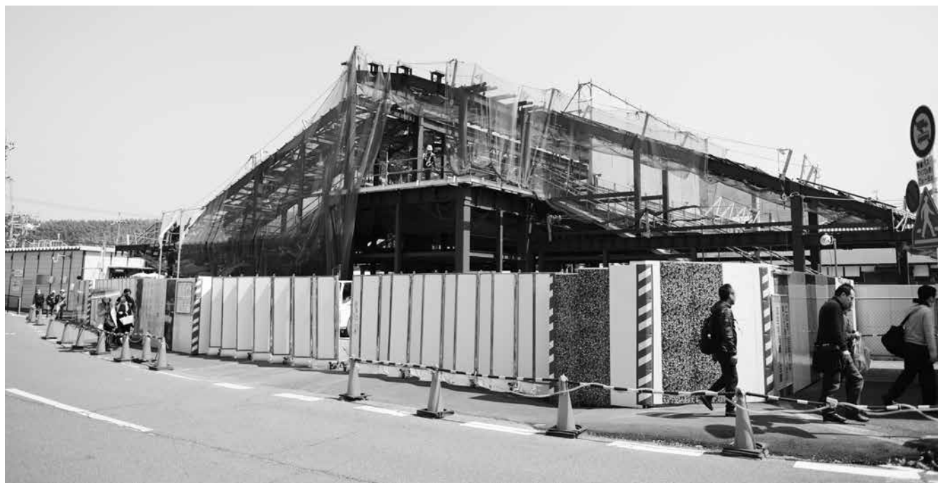
建設中の JR 玉水駅新駅舎