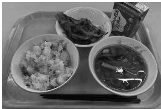
学校給食費の全額補助を実施します