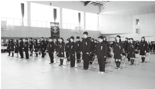
緊張した面持ちで入学式に臨む新入生たち