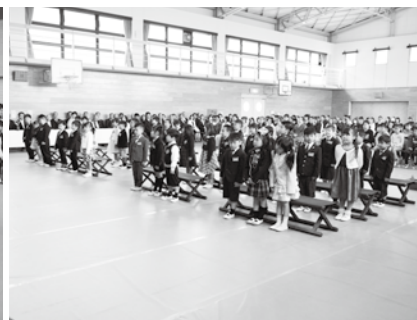
井手小学校の入学式