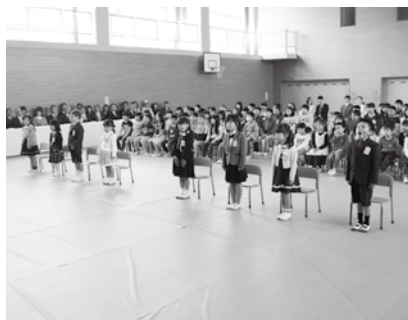
多賀小学校の入学式