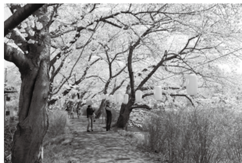
桜が満開の玉川堤

第27回井手町さくらまつりが、4月1日（日）から10日（火）まで開かれ、今年も多くの花見客でにぎわいました。