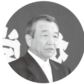
祝辞を述べる汐見町長