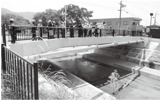
上玉川橋などを視察する参加者の皆さん