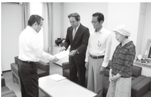
汐見町長にメッセージを手渡す皆さん

のない安全で安心な地域社会を築くことを目的に、犯罪や非行の防止と罪を犯した人たちの更生について、地域の理解を深めようという取り組みです。