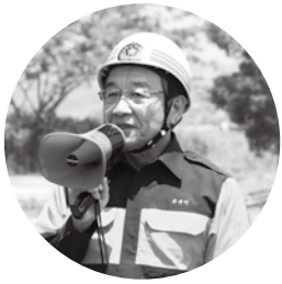
関係機関の災害対策の取り組みに感謝を述べる汐見町長