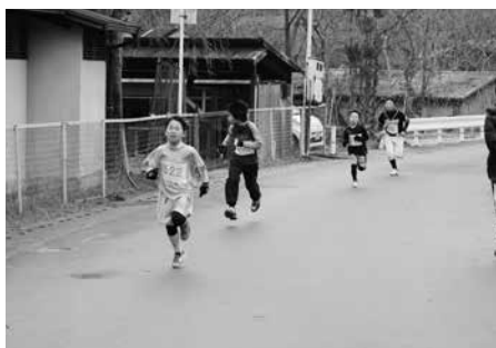
ゴールを目指して力走する選手の皆さん