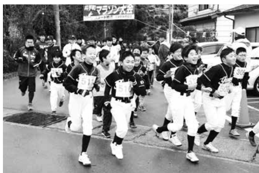
元気にスタートする選手の皆さん