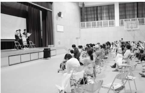
(上) (中) まちづくりセンター椿坂やJR玉水駅前で行われた撮影の様子。(下) 泉ヶ丘中学校で試写が行われたお茶の京都映画祭の様子