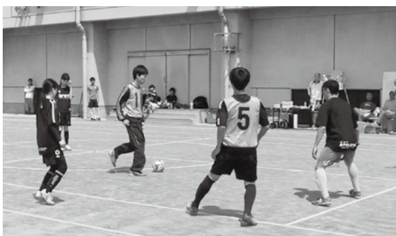
総合開会式に続いて行われた町民フットサル大会