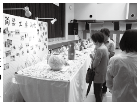
来場者でにぎわうふれあいギャラリーの会場

4月28日(土)、29日(日)の2日間、自然休養村管理センターホールで井手町文化協会の合同作品展「第8回ふれあいギャラリー」が開かれました。