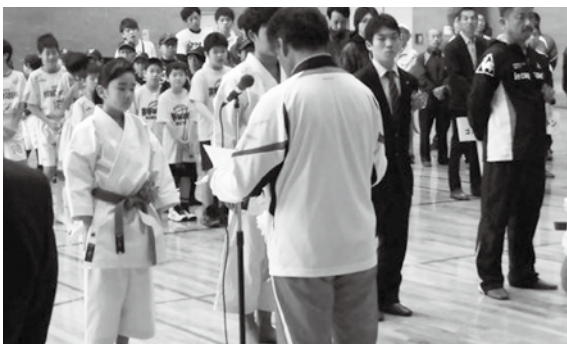
表彰を受ける選手の方々

また総合開会式に続いて、府立山城勤労者福祉会館では町民フットサル大会も行われ、出場した4チームが熱戦を繰り広げました。