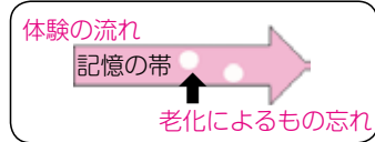
(老化によるもの忘れの場合)

であり、ある体験の一部を忘れ、ヒントがあれば思い出出すことができます。一方、認知症の場合、体験全体がすっぽりと抜け落ち、ヒントがあっても思い出せません。進行すると日常生活に大きな支障をきたすことがあります。