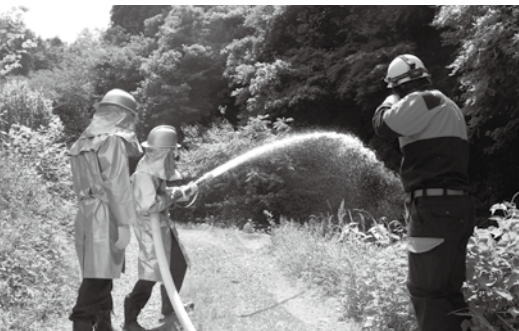
本番さながらの訓練を繰り返す団員の皆さん

訓練は、水防訓練と交互に隔年で行われています。今回は、ハイカーの火の不始末により山林火災が発生し強風などにより延焼の恐れがあるとの想定で行われ、団員