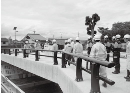
開通間近の上玉川橋を視察する参加者の皆さん