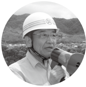
関係機関の災害対策の取り組みに感謝を述べる汐見町長