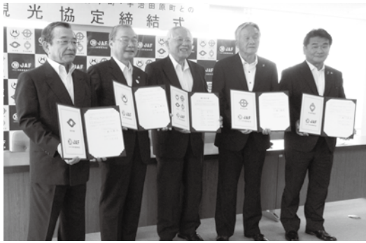
京田辺市で行われた観光協定締結式

調印式には汐見明男町長をはじめ各市町の首長とJAF京都支店の森川莫臣支部長が出席し、それぞれ協定書に署名されました。今後は、JAFの情報誌やホームページなどを通じて、各市町の魅力や観光ス