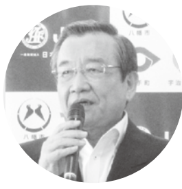
締結式であいさつする汐見町長