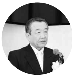
式辞を述べる汐見町長

式典には約250人が出席。町を舞台に撮影された映画「神様の轍」の作道雄監督による記念の動画が上