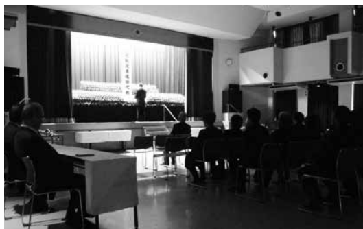
自然休養村管理センターで営まれた戦没者追悼式