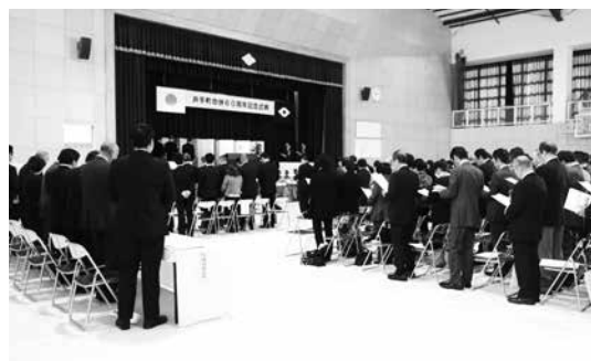
泉ヶ丘中学校で開催した合併60周年記念式典

式典には約250人が出席。町を舞台に撮影された映画「神様の轍」の作道雄監督による記念の動画が上