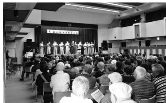
盛り上がった舞台発表