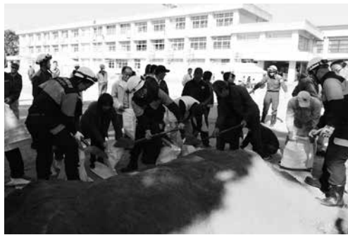
土のう作りを体験する参加者の皆さん(井手小)

全会場合わせて約500人が参加され、豪雨による水害に備えて、災害対策本部や避難所の開設をはじめ、各会場では、自主防災組織や消防団、京田辺市消防署井手分署、住民の皆さんによる避難訓練や応急手当の訓練、土のう作りや土のうを並べて浸水を防ぐ訓練などが繰り広げられました。また非常食の炊き出しも行われ、参加した皆さんが試食されました。