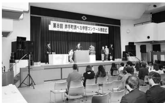
自然休養村管理センターホールで行われた表彰式

われ、大いににぎわいました。また各種団体などによる模擬店も人気を集めるなど、会場を訪れた多くの人たちが文化の秋を堪能しました。