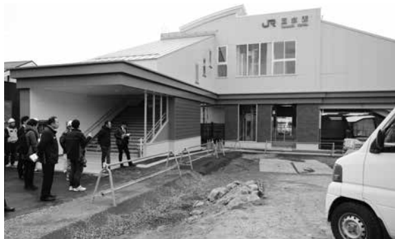
新設された駅東口

JR玉水駅の新駅舎が完成し、12月15日（土）から供用開始となりました。新しい駅舎は、橋上化に伴いエレベーターが設置されたほか、トイレなどもバリアフリー化が図られました。また駅東西をつなぐ自由通路も設けられ、利便性