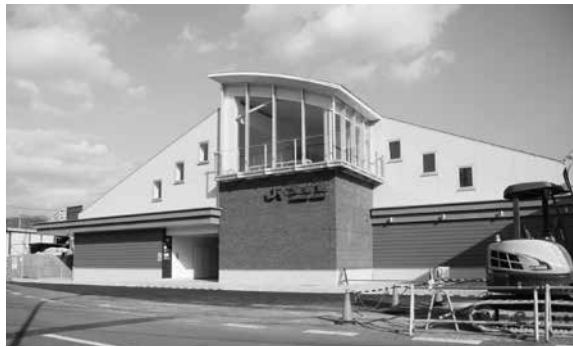
供用開始となったJR玉水駅の橋上駅舎