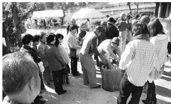
「歴史と文化が色づくまちづくりプロジェクト」のひとつ

が大きく向上しました。駅舎のデザインは、平成27年度に行われた町内の中学生・高校生・大学生によるワークショップで打ち出された「井手の桜と歴史の玄関口」をコンセプトに手掛けられました。今後は仮駅舎の撤去や、