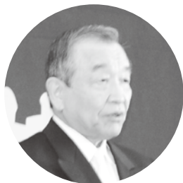
祝辞を述べる汐見町長