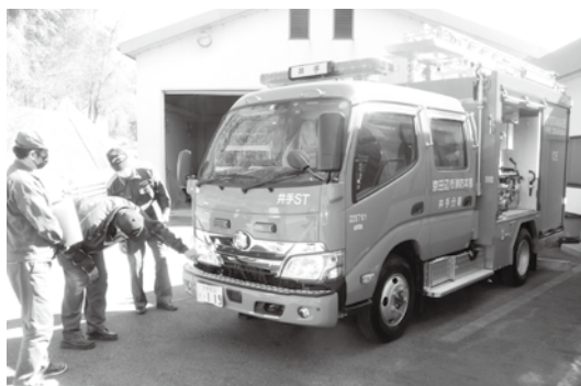
3月6日より運用を開始した新型消防ポンプ車

京田辺市消防署井手分署のポンプ車1台を更新し、3月6日（月）から運用を開始しました。ポンプ車の更新は19年ぶり。「圧縮空気泡消火装置」などを装備した最新型となりました。