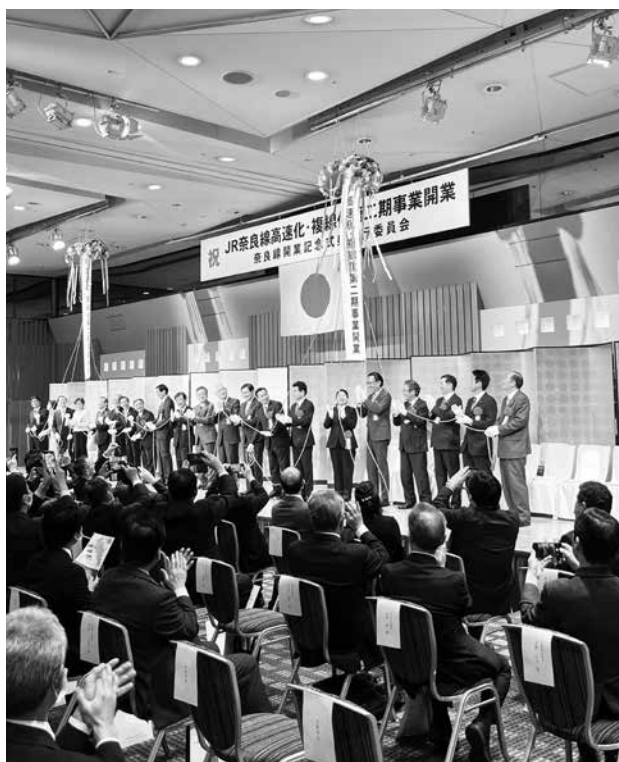
開業記念式典のひとコマ