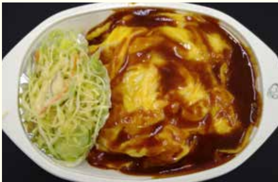
日替わり弁当の一例「オムライス」