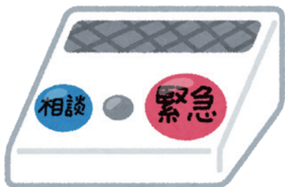
緊急時通報装置で地域の安心を