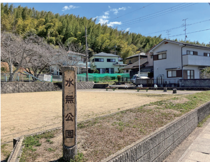
公園の人工芝化を