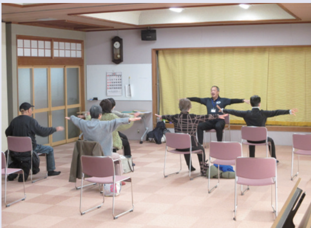
「はつらつ元気講座」の様子