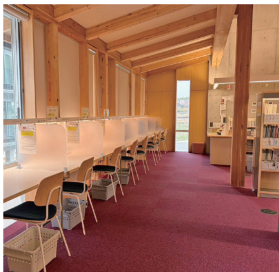
自習室としても活用される図書館