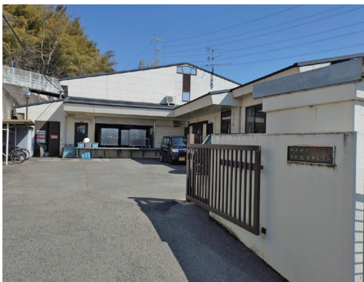
食料の提供拠点となる給食センター