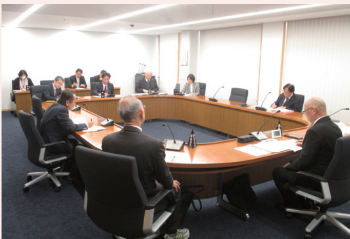
新規条例の審査が行われました

委員からは、令和8年度から開始となるこの事業の制度概要や目的、利用時のメリット、12月定例会で審議した条例との違いなどについての質疑がありました。