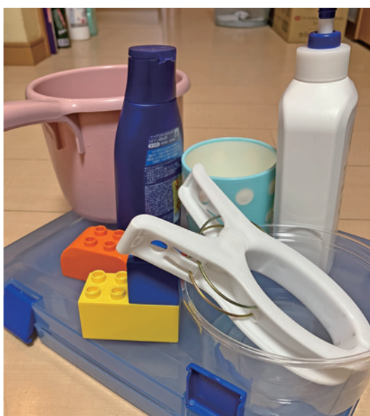
「プラスチック資源」として回収