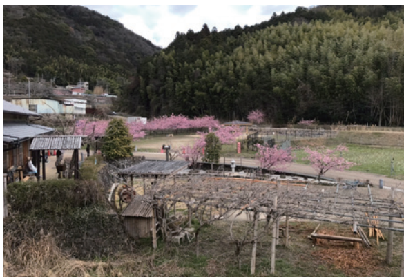
椿坂周辺の放置竹林