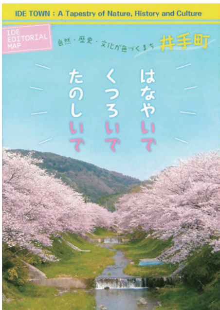
豊かな自然をアピールしています