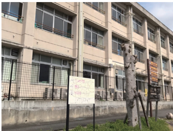
改修予定の多賀小学校外壁