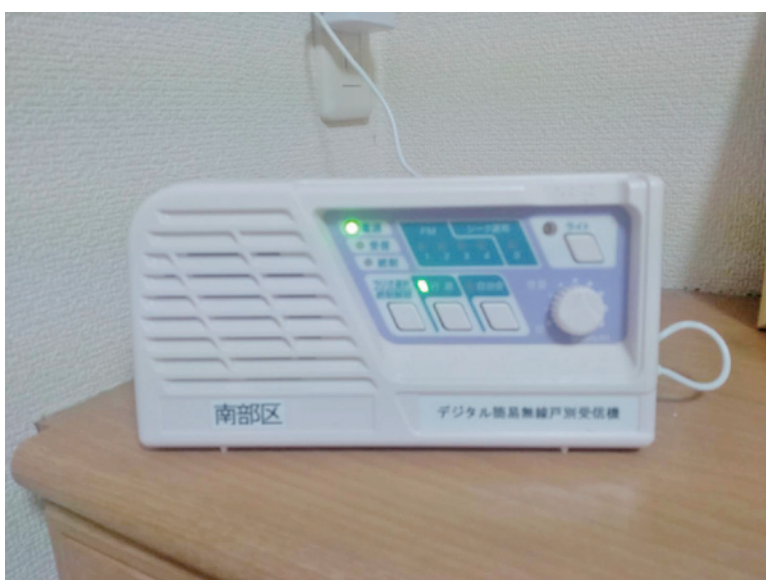
デジタル簡易無線戸別受信機