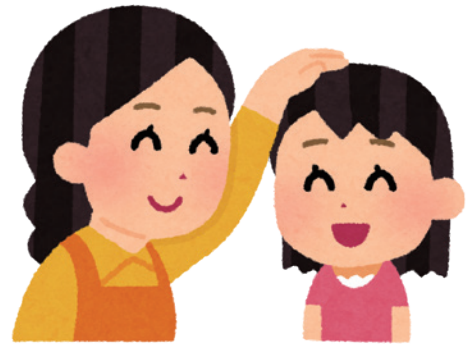
遊びや親との関わりを通して育まれる非認知能力

幼児教育からの学びの連続性を重視し、保・小・中が連携して「認知能力」と「非認知能力」を一体的に育める体制づくりを推進する。