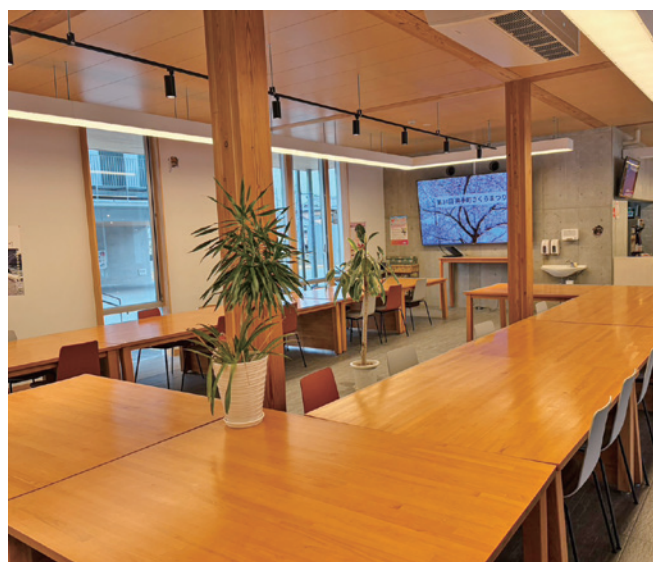
同窓会などのイベントでも使用されるテオテラスいで