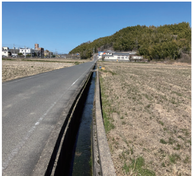
車両の往来が多い町道19-13号線