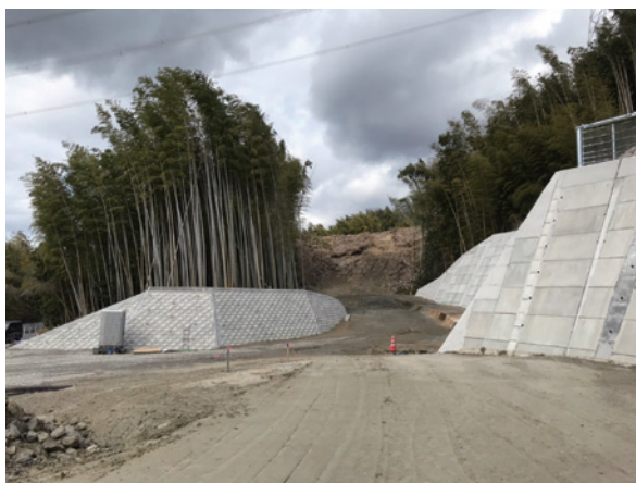
井手やまぶき支援学校へのアクセス道路