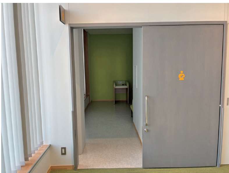
授乳室は搾乳できるよう整備されています

問 対象者全てに配布。低出生体重児を育てる方、妊婦や子育て中の不安や悩みを丁寧に対応し、きめ細やかな支援を継続していく。