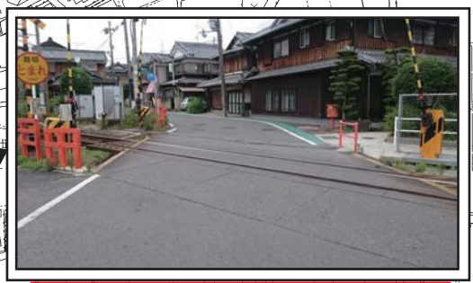
交通量が多いため、通行注意

指定された避難所への避難行動を起こすのは、“河川がはん濫しそうな時”です。詳しくは裏面の「 避難を始めるきっかけ」を参照ください。