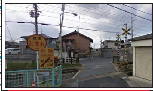
交通量が多いため、通行注意

指定された避難所への避難行動を起こすのは、“河川がはん濫しそうな時”です。詳しくは裏面の「 避難を始めるきっかけ」を参照ください。