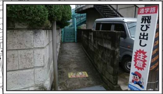
歩道橋の為、要配慮者は通行が困難