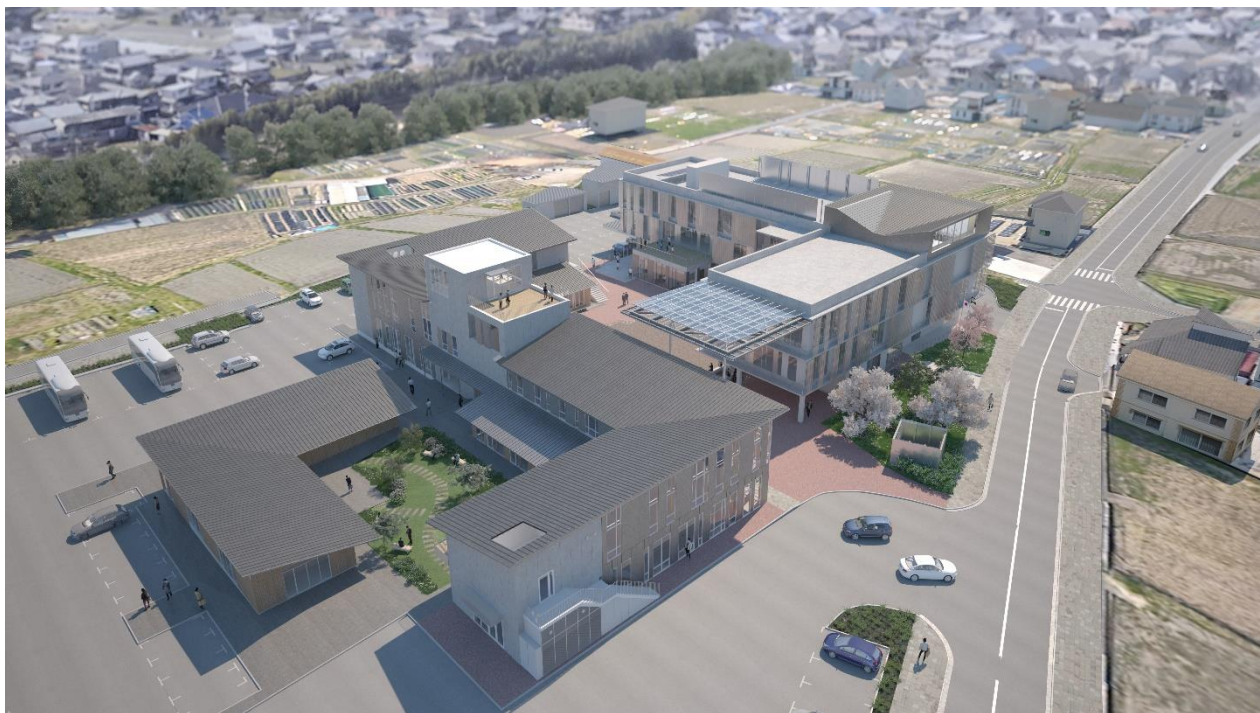
▲山吹ふれあいセンターを含む新庁舎敷地の全体像