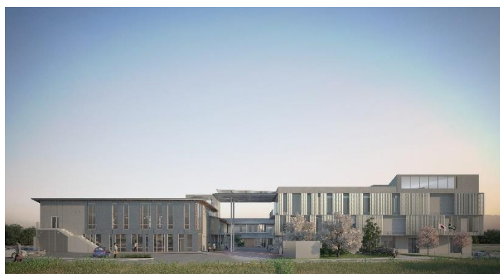
▲府道から見た山吹ふれあいセンターと新庁舎