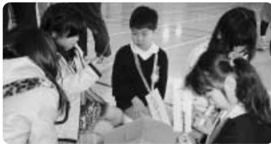
紙とんぼづくりにチャレンジする園児たち

桜の咲く四月、井手小学校・多賀小学校の新年生になる、玉川・多賀両保育園児や幼稚園を卒業する子どもたちの半日体験入学が二月六日(金)に多賀小で、二月二十七日(金)に井手小で行われました。