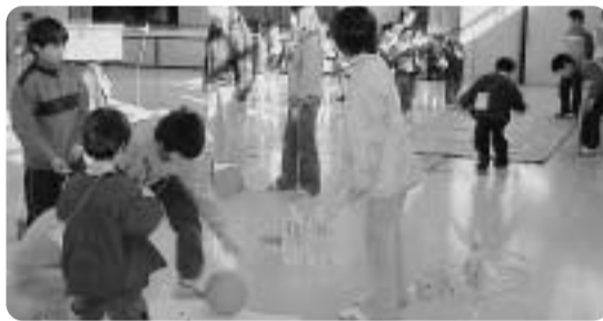
ペットボトルボウリングを楽しみました