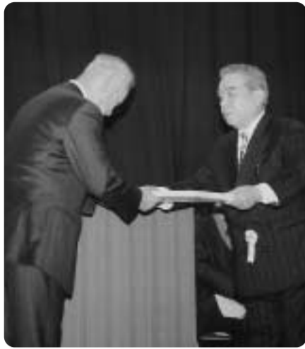
社会福祉の貢献された方々に表彰状・感謝状が手渡されました