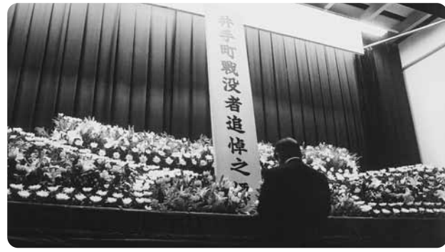
追悼の言葉を述べる汐見町長

式典には、遺族や町内外から来ひんの方々約130人が参列されるなか、全員による黙とうがさざげられました。汐見町長は「先の戦争により最愛の肉親を犠牲に捧げられたご遺族の皆さんのご心情を察すると、お慰めの言葉も