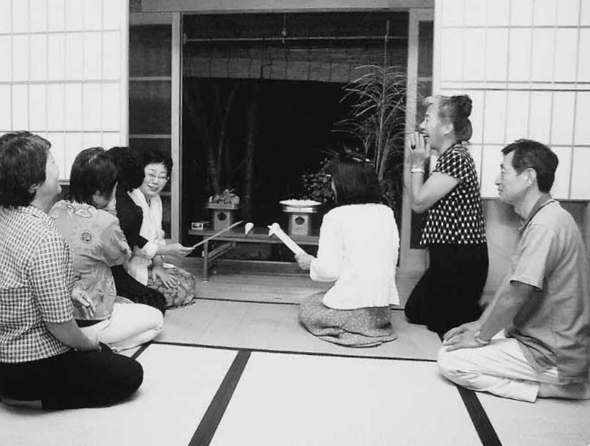
▲9月28日(火)、まちづくりセンター椿坂で「十五夜お月見会」が行われました。中秋の名月に合わせ昨年到现在に続いて2回目の開催となったこの日は、曇り空のため月は見えませんでしたが、訪れた皆さんは手作りの「月見だんご」を味わい、短歌を詠みながら楽しんでいました。