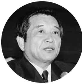
挨拶をする汐見町長