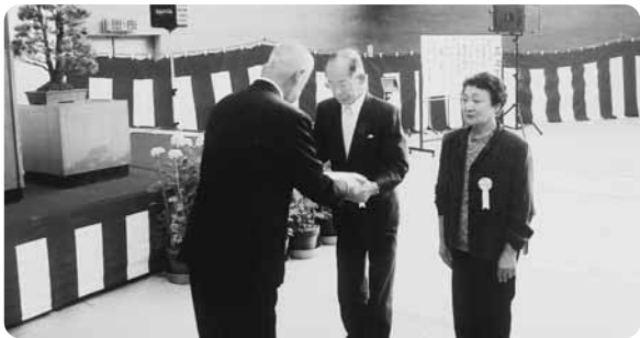
西島社協会長から賞状と記念品が手渡されました

団、茶碗・湯呑みセット)が贈られました。昼食のお弁当を食べたあとには「素人演芸会」が行われ、町高齢者サークルに加入されているカラオケや舞踊教室のメンバーから歌謡曲や日本舞踊などが披露されました。このほかにも、いづみ保育園の園児たちが歌と踊りを披露、最後に「いつももお元気でいてください」と、おじちゃん・おばあちゃんに心温まるメッセージを贈りました。会場では大きな拍手や歓声