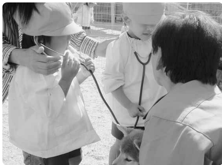
▲10月15日(金)、いづみ保育園で「動物ふれあい教室」が開かれ、園児36人が、パネルを使った動物あてクイズや子犬の心臓の音を聴診器で聴き取る体験などを通じて命の大切さを体感しました。この取り組みは、身近な動物とふれあう機会を通して、動物愛護意識を高めるのと友達への思いやりの気持ちを育ててもらうことを目的に府動物愛護管理センターが開設しているもの。今回訪れたセンターの成犬1匹、子犬・ウサギ・モルモット各10匹に園児たちがキャベツやニンジンなどをあたえたり、抱き上げたりしてふれあいを楽しんでいました。