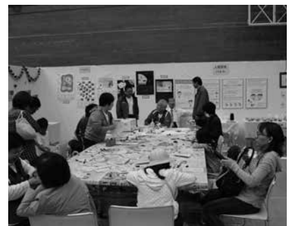
にぎわう展示コーナー

和太鼓や大正琴、バンド演奏などが繰り広げられたほか、第30回青少年の主張大会や第4回調べる学習コンクール表彰式、各サークル・教室の作品展、農作物等品評会、健康のつどい(骨量測定、血管年齢他)なども行われ、大いにぎわいました。 また各種団体などによる数多くの模擬店も立ち並び人気を集めるなど、会場を訪れた多くの人たちが文化の秋を堪能しました。