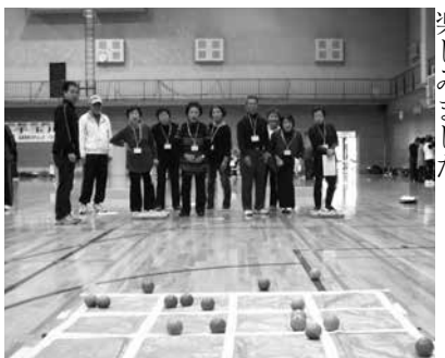
ペタピンゴを楽しむ参加者の皆さん

府立山城勤労者福祉会館で11月15日(土)、井手玉川大学と井手町スポーツ推進委員会などによる「玉川大学 体力チェック・ペタピンゴ大会」が開かれました。住民の方々の健康増進を目的とした事業で、84の方が参加し、和気あいあいとした雰囲気の中、6種目の体力チェックを行いペタピンゴを楽しみました。