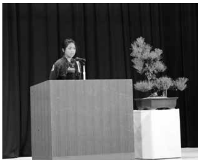
青少年の主張大会で発表する児童