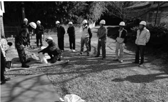
土のう作りに取り組む皆さん（自然休養村管理センター）