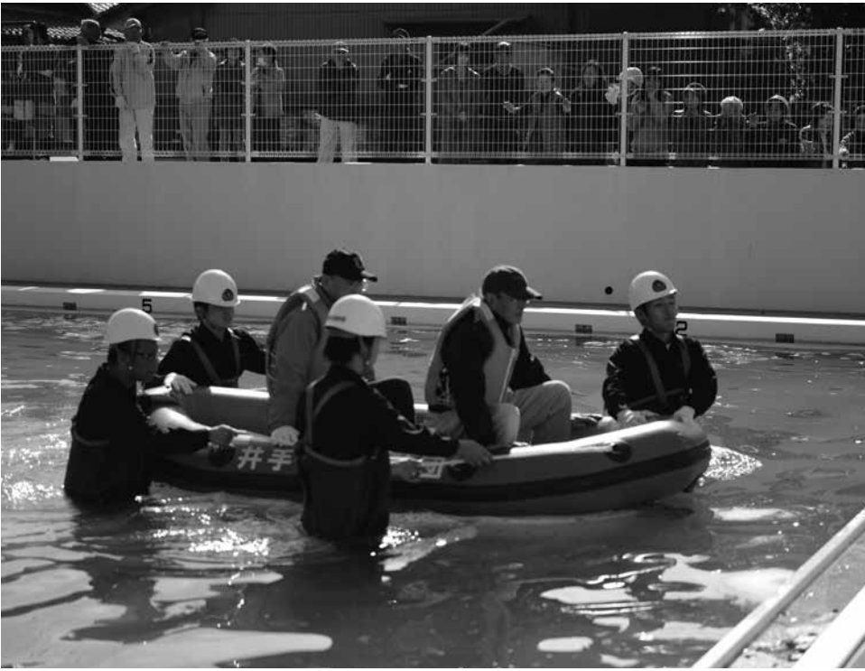
プールで行われたボートによる救助訓練の様相（井手小学校）

はじめ、避難所開設や炊き出し、避難所への浸水を防ぐ土のう作りなどの訓練が各所で 行われたほか、学校のプールでは、消防団員によるゴムボートを使った救助訓練などが本番さながらに繰り返し行われま