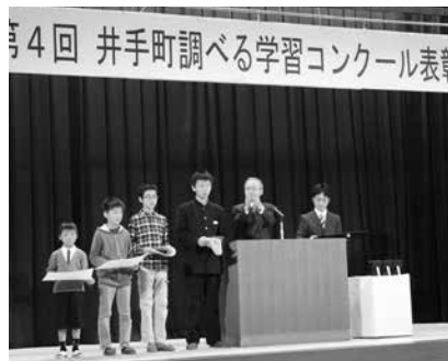
調べる学習コンクールの表彰式