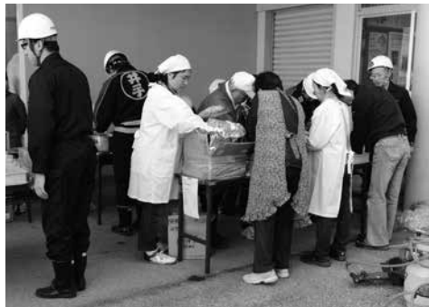
炊き出しに取り組む皆さん（多賀小学校）