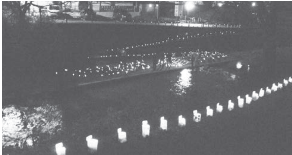
色とりどりの灯籠で飾られた玉川（玉泉苑前）

るイルミネーションイベント「みんなで灯そう！井手みねーしょん」も行われ、学生たちが放置竹林から切り出した竹で作った灯籠をはじめ、町内の保育園や小学校の子どもたちが作った牛乳パックの灯籠などLEDで点灯する約2,300個の灯籠が、夜の玉川に燈され、訪れた人々を楽しませました。