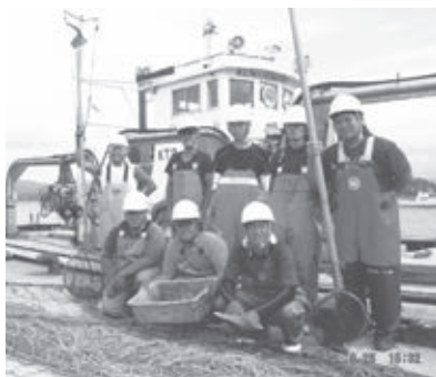
「海の民学舎」第1期研修生募集パンフレットより