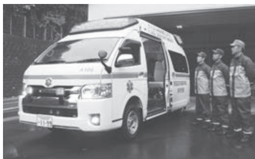
12月1日から運用を開始した新型高規格救急車