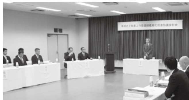
山城勤労者福祉会館で開かれた総会

も、工事がスムーズに進むよう、これまで以上にJ Rとの連携を密にしていくなが必要があります。もちろん、私どもの最終目的は全線複線化であり、促進協として、これからも利用促進につながるハード・ソフト事業などにもしっかりと取り組む必要があると考えます」と述べ、出席した来賓や顧問の方々の協力を要請しました。