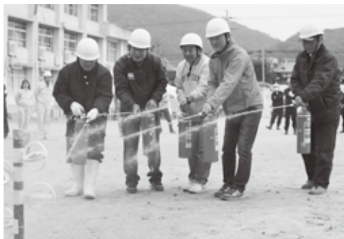
消火器の訓練に励む参加者の皆さん（井手小）

11月22日（日）、井手小学校、多賀小学校、玉川保育園、自然休養村管理センターで井手町防災訓練を行いました。全会場合わせて約470人が参加され、巨大地震による災害に備えて、避難経路や負傷者の応急処置、消火作業の手順などを確認しました。