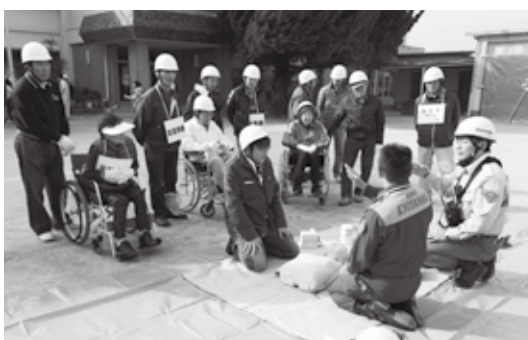
応急救護について説明を受ける参加者の皆さん（多賀小）