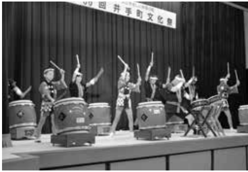
熱演が繰り広げられた舞台発表