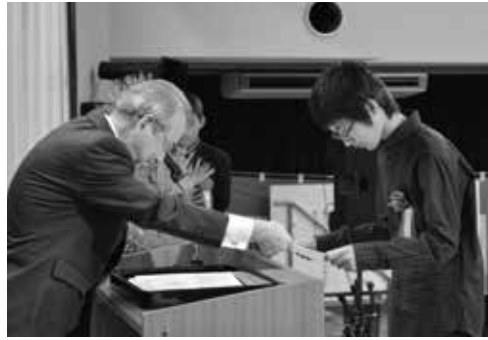
第5回調べる学習コンクールの表彰式

第31回青少年の主張大会や第5回調べる学習コンクール表彰式、各サークル・教室の作品展、農作物等品評会、健康のつどいなども行われ、大いにぎわいました。 また各種団体などによる模擬店も人気を集めるなど、会場を訪れた多くの人たちが文化の秋を堪能しました。