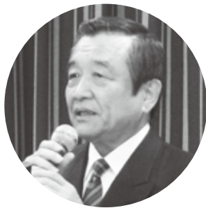
あいさつを述べる汐見会長

また「概ね10年の整備期間を予定するこの第一期事業も、残すところあと7年ほどしかなく、私どもといたしまして