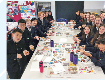
国際交流・海外派遣事業