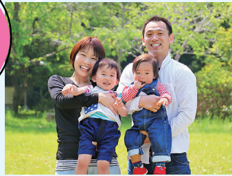
井手町出産応援給付金