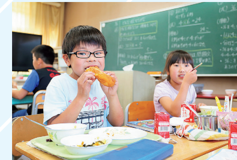
町立保育園・小中学校給食費無償化