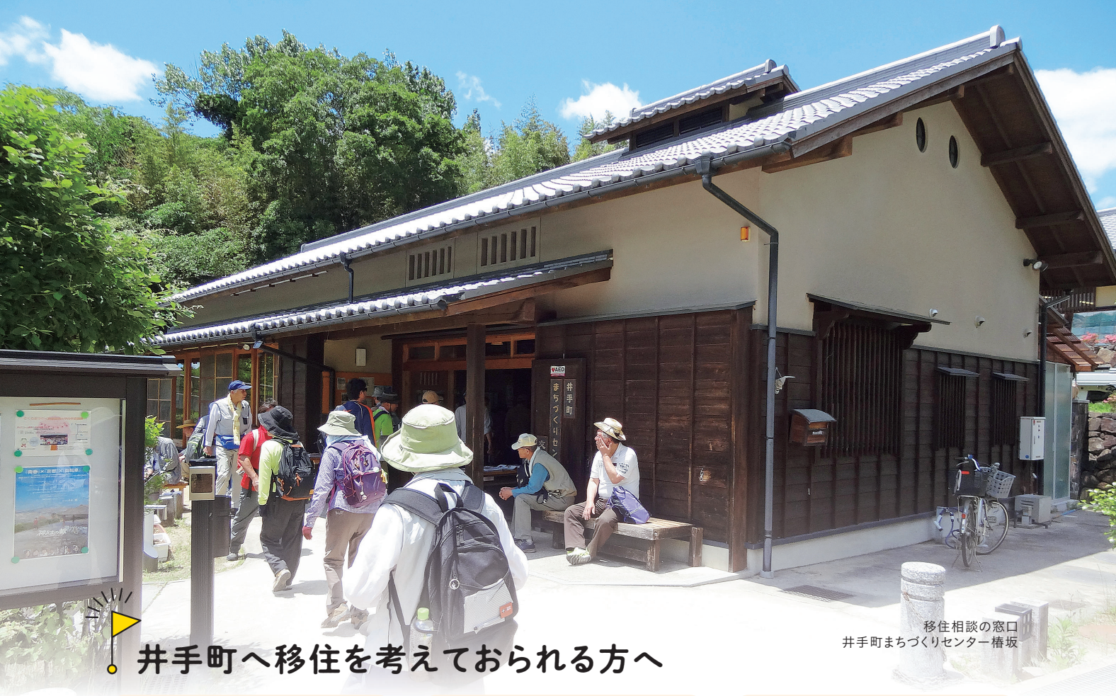
移住相談の窓口 井手町まちづくりセンター橋坂