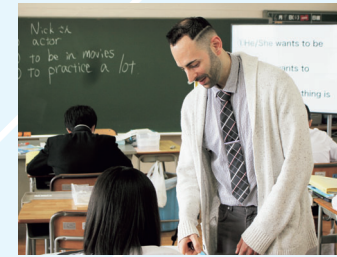
英検・数検チャレンジ推進事業