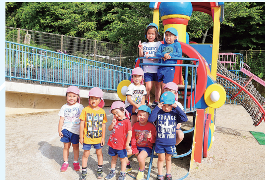
町立保育園第2子以降保育料無償化