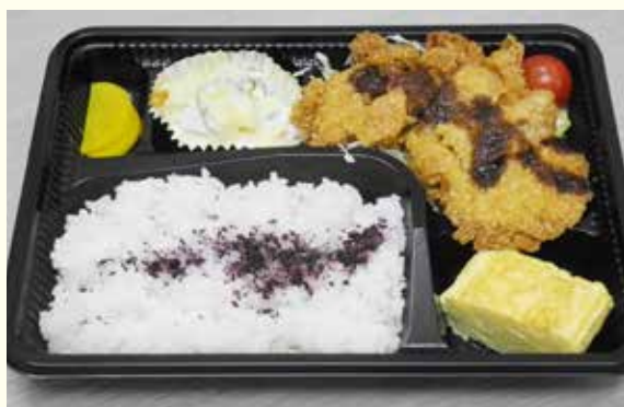
日替わり弁当の一例「とんかつ」