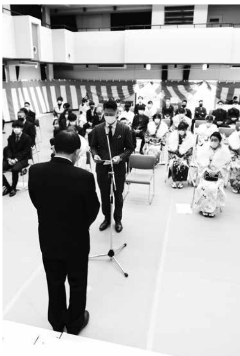
自然休養村管理センターで行われた成人式

自然休養村管理センターで1月9日(日)、井手町成人式が行われました。今年の新成人は59人です。