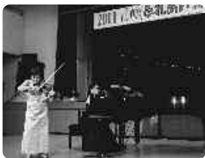
素晴らしい音色がホールを包みました

コンサートの最後には、参加者全員で「千の風になつて」「浜辺の歌」「ふるさと」を合唱しました。