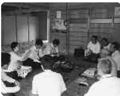
椿坂で意見交換をする研修員

研修を終えた研修員からは「子供からお年寄りまで、幅広い年齢層の方と直接触れ合うことができたのが良かった」との感想が聞かれました。