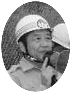
挨拶をする汐見町長

城北土木事務所、府田辺警察署、町消防団、京田辺市消防署井手分署など関係各機関から約20人が参加しました。