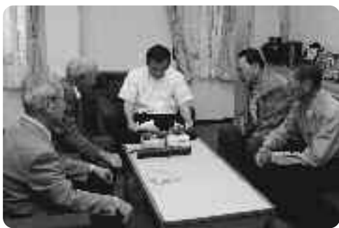
受賞報告をするカジカガエル保護友の会の方

また、「今回の表彰は、いい記念になります。これからますます大変です」など感想を話されていました。