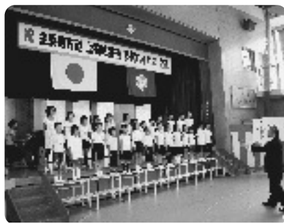
きらきらランド少年少女合唱団によるコーラス