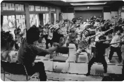
井手町ミニサロン体操をする参加者

この日は、町社協オリジナル体操の『井手町ミニサロン体操』が行われ、参加者らは『きよしのズンドコ節』の歌に合わせて、楽しく体操をしていました。