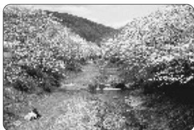
桜並木の保全など