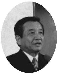
挨拶をする汐見町長

昨年8月から一部供用開始となっていた多賀バイパスの全線開通を祝う式典が、9月20日(土)に多賀小学校で行われました。