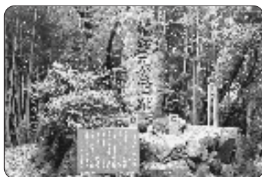
橋諸兄公旧跡整備など