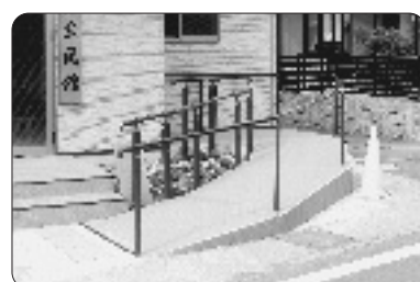
バリアフリー整備など