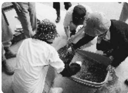
白菜の種まきを行う参加者