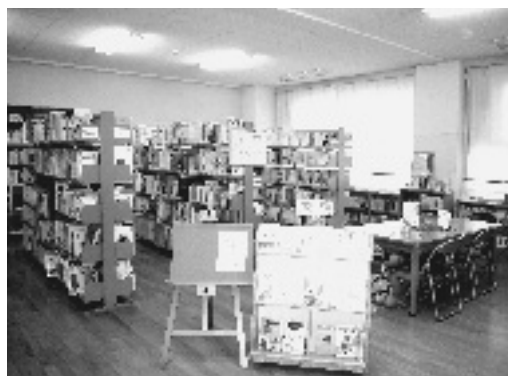
泉ヶ丘中学校の学校図書館

館支援センター推進事業」の委託を受ける(平成20年)。司書の活動・連携の充実。学校図書館調査研究会の設置。 ●平成19年 町独自に予算措置を行って新たに約7,000冊の学校図書を購入。小・中学校の図書整備率100%を達成。読書ボランティア講座、学校図書館づくり講座の開催。