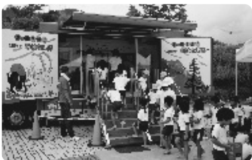
お気に入りの絵本を探す園児ら

山吹ふれあいセンター集会所で絵本の読み聞かせがあり、隊員の方や読み聞かせボランティアの方が読み始めると園児らは、夢中になっていました。また、同センター前の広場では、キャラバンカーに積み込まれた約500冊の絵本の中からお気に入りの本を手に取り、夢中になって読んでいました。