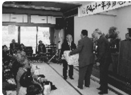
記念品が渡されました

演芸発表では、各サークルのメンバーや役員の方が日頃練習を重ねたコーラスや日本舞踊、カラオケなどを披露。この中で招待を受けた多賀保育園児たちは、一人ずつ自己紹介を行い、手話を交えた歌や踊り、太鼓演奏を披露し、会場は大いに盛り上がりました。