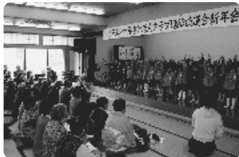
踊りを披露する園児

めでたく米寿を迎えられた15名の方に、多賀老人クラブから『ふとん』が、喜寿を迎えられた27名の方には、『杖』が記念品として贈呈されました。