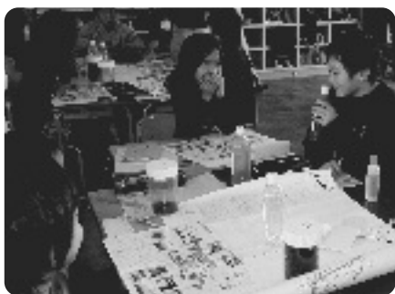
放流水などの“におい”を体験する児童

授業では、「下水道管の役割」や「洛南浄化センターでの処理」などについて説明があり、実際に処理場に入ってくる下水（流入下水）や処理した後の水（放流水）や汚泥（乾燥汚泥・脱水汚泥）の「におい」も体験しました。また、下水道の仕組みや地球温暖化との関係をクイズなどを交えて学びました。