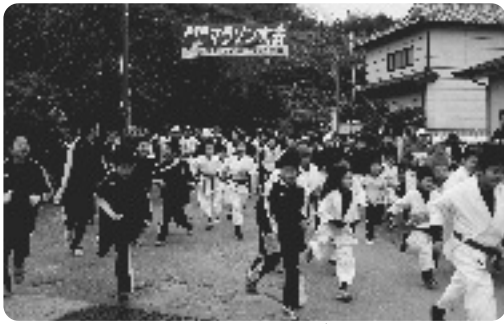
一斉にスタートする参加者