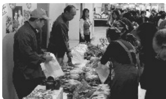
飛ぶようにうれた特産品・新鮮野菜

同協議会のブースには、たくさんの方が訪れ、トラック2台分の野菜や特産品が飛び売りに売れ、両日も完売しました。