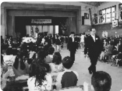
在校生に見送られる卒業生(井手小)

な拍手のなか卒業生が入場。全員による校歌斉唱のあと、卒業生一人ひとりの名前が読み上げられ、卒業証書が松本校長からクラスの代表者に手渡されました。 松本校長は式辞で「楽しい時ばかりではなく、苦しい時やつらい時があるが、そんな時こそ希望を持つ事が大切。その希望の実現に向かって努力してください」と述べられました。引き続き在校生代表と先生方による『構成詩』が巣立っていく卒業生に語りかけられると、卒業生の中には、3年間のさまざまな思い出があふれ出し、涙する生徒も・・・。