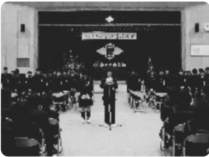
巣立ちの決意を述べる卒業生代表(泉ヶ丘中)

このあと卒業生代表が3年間の中学校生活の思い出を語り、力強く巣立ちの決意を述べ、卒業生は新しい人生のスタートを切りました。