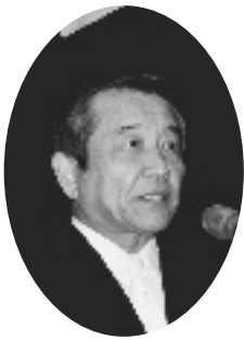
祝辞を述べる汐見町長