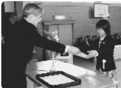
卒業証書が手渡されました(多賀小)