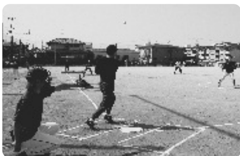
青空の下熱戦が繰り広げられました