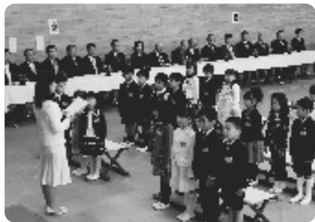
元気いっぱい返事をする1年生【井手小】