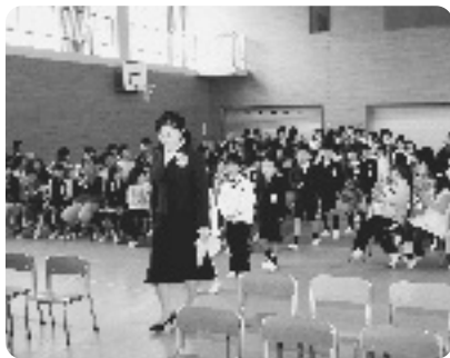
拍手の中入場する1年生【多賀小】

席についた新一年生らは、担任の先生から名前を呼ばれると元気よく『はい』と返事をし、これから始まる新しい小学校生活の一日目がスタートしました。 今年度の新1年生は、井手小学校41人(男子24人・女子17人)、多賀小学校22人(男子12人・女子10人)が、ピカピカの1年生として迎えられました。