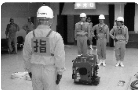
小型ポンプ操法の訓練を行う選手