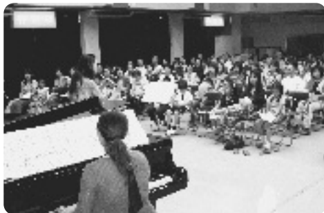
オーボエとピアノの美しい音色に聞き入る会場