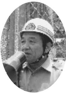
挨拶を述べる汐見町長