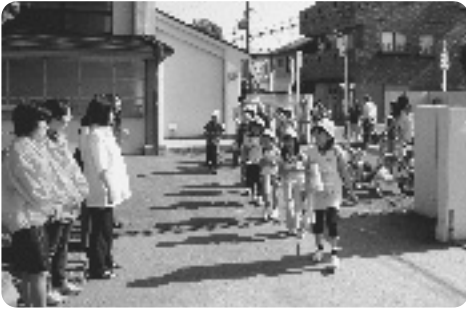
元気にあいさつする児童たち(井手小学校)

6月1日(月)～5日(金)、泉ヶ丘中学校・井手小学校・多賀小学校で、「さわやかあいさつ運動」が行われました。