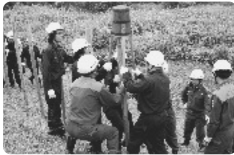
杭打ち積み土のう訓練の様子

得することにより、水害等に対処できる水防技能の向上を図ることを目的に2年に1度行われているもので、参加した団員らは水防工法の基本とされる「杭打ち積み土のう工法」「月の輪工法」「積み土のう工法」などの訓練を実施したほか、浸水した家屋からの救助を想定した「救命ポート」を