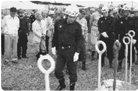
視察を行う汐見町長