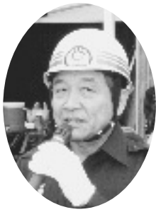
講評を述べる汐見町長

訓練は「梅雨の出水期」や「台風シーズンの豪雨」を想定し、消防団員が実践的訓練を通じて基礎的な水防工法を習