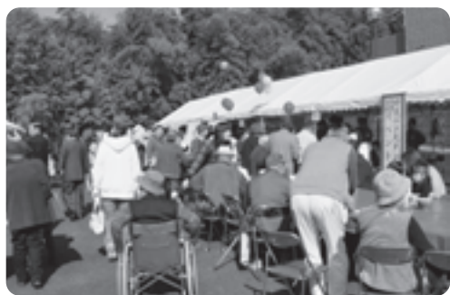
大勢の来場者で賑わいました