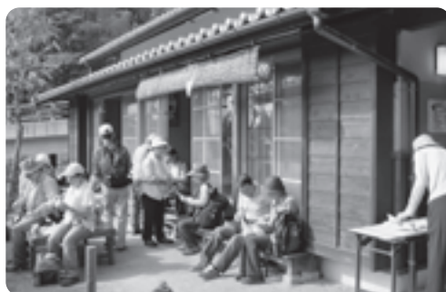
ウォーキング客でにぎわう榎坂

コースのほぼ中間地点となるまちづくりセンター榎坂ではお茶のふるまい、特産品やコーヒーの販売を行ったほか、休憩スペースとして建物を開放し、立ち寄った参加者たちは、お弁当を広げるなど、のどかなひと時を満喫していました。