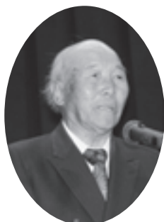
挨拶をする小川委員長