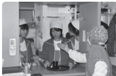
玉水駅前休憩所さくらでの就業体験

尊さを学び、将来の進路についての関心と理解を高めようという取組みで、2年生56人が町内の工場や商店、図書館や飲食店などで、それぞれの業務の一端を体験しました。