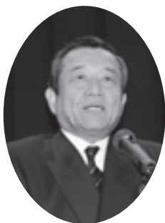
祝辞を述べる汐見町長

『きりぎりすランド少年少女合唱団』による合唱や『いづみ太鼓左馬』による和太鼓演奏、いづみまなび教室のメンバーによる大正琴演奏や太極拳の演技、町空手道教室の生徒による空手道演武、一般参加者からのカラオケやコーラス、バンド演奏などが披露され、