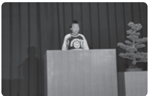
青少年の主張大会

会場では割れんばかりの拍手が響き渡っていました。 山城勤労者福祉会館では、各サークルや教室、一般からの力作が所せましと展示され、訪れた人たちは足を止め熱心に眺めていました。また、京田辺市消防署井手分署の分署員が運転するミニ消防車に乗車できる消防の広場なども催されていました。 自然休養村管理センター広場では、うどんや天ぷら、フライドポテトやスノーパールすくいなどの模擬店のほか、パワーツヨベルを操作して文字を書く『DOBOCON祭』が催され、「桜」の文字を書き上げていました。 文化祭の開会式典では、町政振興のために貢献していただいた方に自治功労者の表彰