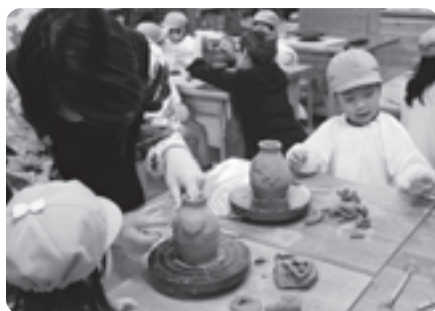
花瓶作りに挑戦する園児