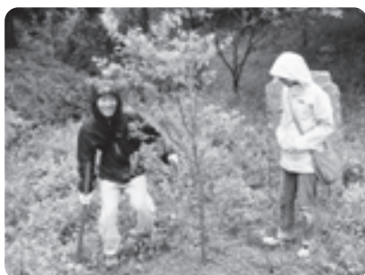
それぞれの願いがこめられ植樹が行われました

また同日、たくみの里でも「新緑のさと山まつり」が開かれました。たくみの里で活動する各工房の工芸品が販売されたほか、手作りキーや手打ち蕎麦などの模擬店が開かれました。