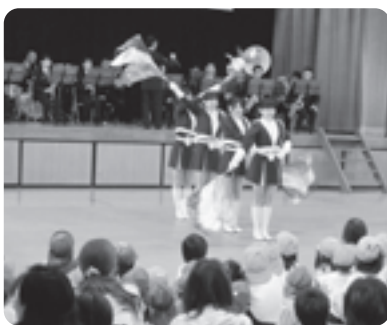
井手小学校校歌などの演奏が行われました【井手小】