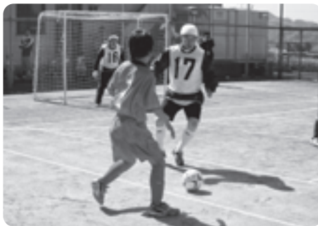
熱戦が繰り広げられました