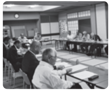
新役員が承認されました