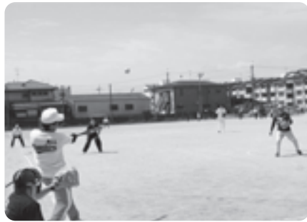
青空の下バットの快音と歓声が響きわたりました