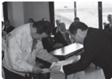
功労者表彰の様子

小川会長はあいさつの中で「昨年実施した20%プレミアム付き商品券は数日で完売と非常に好評でした。今年もプレミアム付き商品券の発行を計画しており、『行きます、聞きます、提案します』を合言葉に地域発展に貢献したいと思っております」と述べられました。