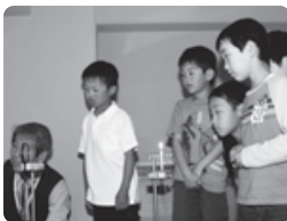
ロウソクを使った凸レンズの実験の様子