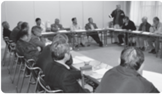
活発な意見交換が行われました

12月5日(月)、山吹ふれあいセンターでゴミ減量化対策検討委員会が行われました。井手町環境審議会委員・井手町区長会で構成する同委員会では、4月から試行されている燃やすゴミの透明袋・半透明袋化の現状と成果を説明し、現在燃やすゴミの袋は約7割が透明袋で出されており、燃やすゴミの量は上半期の前年度同月比で人口1日1人あたり30g減っています。また、その他ゴミは前年度同月比で7g増えており、透明袋・半透明袋化により分別が促進された結果、その他ゴミが増えたと考えられること