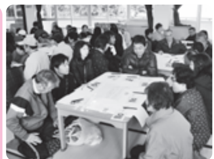
クロスロードゲームでは活発な意見交換が行われました