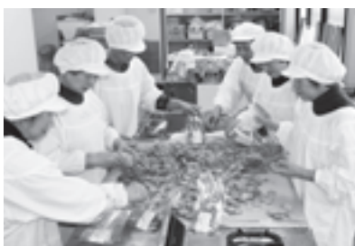
1つ1つ、ていねいに手作りしています

平成24年経済センサス・活動調査を実施します 平成24年2月1日現在で、全ての企業・事業所を対象とした経済センサス・活動調査を実施します。支社等のない事業所には、調査員が直接伺い、調査票をお配りします。支社等を有する企業には、国や京都府が民間事業者を通じて本社等に調査票を郵送します。調査票は、平成24年1月末日までにお届けしますので、調査の趣旨・必要性をご理解いただき、ご回答をよろしくお願いいたします。