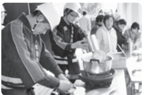
炊き出し訓練の様子

また、水害学習会として専門家を交えてのクロスロードゲームも行われ、「避難時に怪我をしたお年寄りに遭遇した。助けて一緒に避難するか。」避難所に自分は食料と水を持ってこれたが周りは持っていない。みんなの前で食事をとるか。」など、万一そのような場面に遭遇した場合を想定し、自分ならばどうするかを話しあい、緊急時の行動