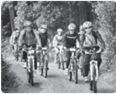
自然を満喫しながらサイクリングを楽しむ参加者