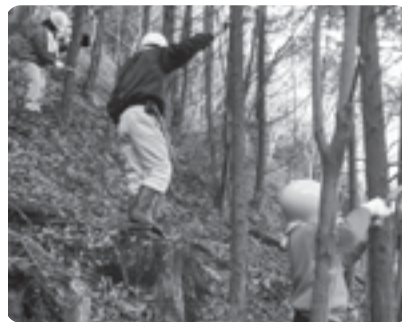
ヒノキの枝払い作業の様子

参加者は、ノコギリを手にヒノキの枝払いなどを体験したほか、チェーンソーを使って木を切り倒す間伐作業のデモンストラーションを見学しました。その後、大正池グリーンパークに移動し昼食を囲み交流を深めました。