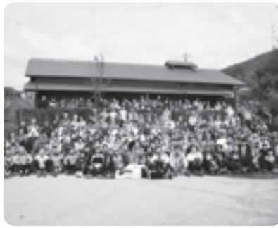
椿坂で記念写真が撮られました

参加者はそれぞれのペースで秋深まる山々を駆け抜け、昼食会場の万灯呂山頂上では、商工会女性部手作りの井手の里汁と町内仕出し店の特製弁当を堪能していました。