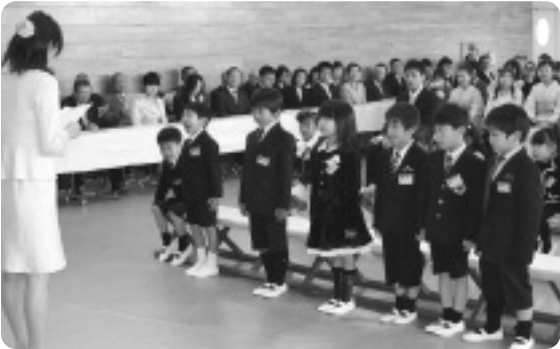
元気よく返事をする1年生【井手小】

今年度は、井手小学校37名(男子19名・女子18名)、多賀小学校17名(男子10名・女子7名)がピカピカの1年生として迎えられました。 その後、来賓のあいさつに続き、1年生に入学祝品が手渡され、在校生から温かい歓迎のことばがかけられました。