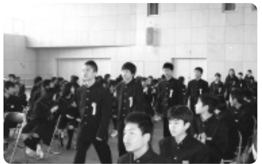
拍手の中入場する1年生【泉ヶ丘中】