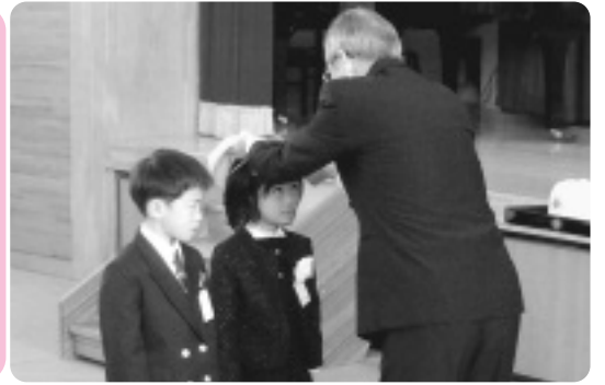
入学祝品が手渡されました【多賀小】