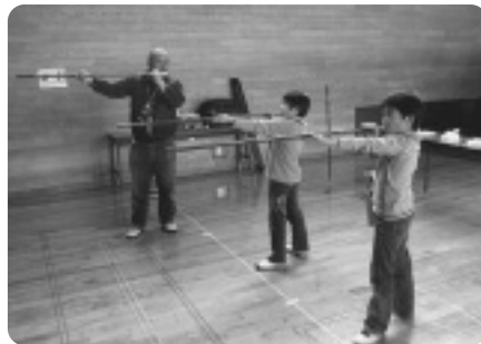
スポーツ吹き矢に挑戦する参加者

ぬいぐるみ図書館お泊り会は、子どもたちのお気に入りのおぬいぐるみや人形を預かり、そのぬいぐるみたちが読書や館内の冒険を楽しんでいる様子を写真に撮影して子どもに渡すという企画です。子