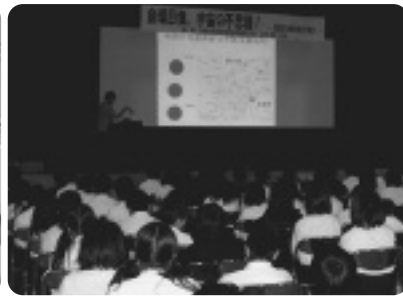
金環日食の仕組みを学ぶ特別授業

また日食当日の21日(月)には希望者約30名が観測会に参加し、教職員とともに熱心に観測を行いました。