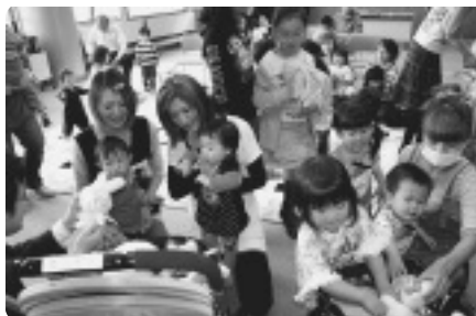
ぬいぐるみを職員に託す子どもたち

どもたちの想像力を高め読書に関心を持ってもらおうと行われました。 年間4回行っている、おはなし会とあわせて、昨年からは実施されており、子ども達は絵本の読み聞かせのあと、それぞれのお気に入りのぬいぐるみや人形を職員に託しました。 子どもたちは翌日以降に、ぬいぐるみや人形を迎えに図書館を訪れ、ぬいぐるみたちが図書館を冒険する写真を熱心に眺めていました。