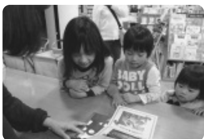
ぬいぐるみのお気に入りとして 図書や絵本が紹介されます