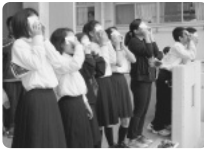
早朝からの観測会