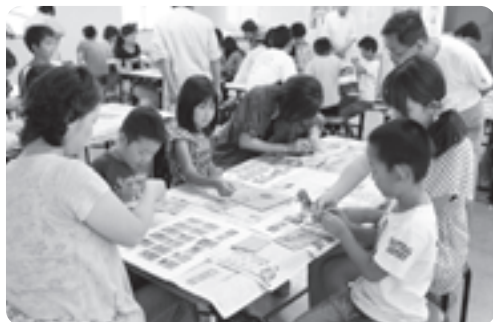
工作教室で保護者と一緒に模型を組み立てる子どもたち