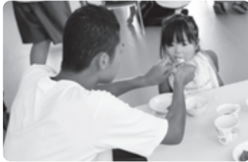
園児と一緒に食べている様子 （いづみ保育園）

生徒たちにとっては、日頃できない体験を通して社会福祉の大切さについて考える機会となりました。