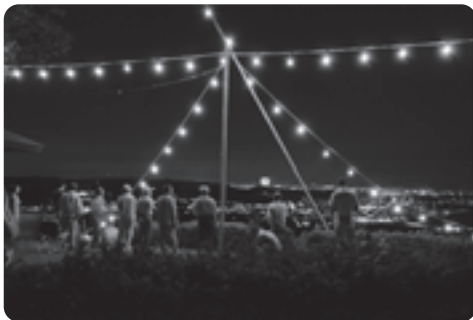
約60個の電球を利用した大文字

展望台では、竹灯籠も飾られ見物客を出迎えました。大文字点灯は、五山の送り火と同じ時間に行われ、午後8時から1時間にわたり夜空に「大」の字が浮かびあがりました。