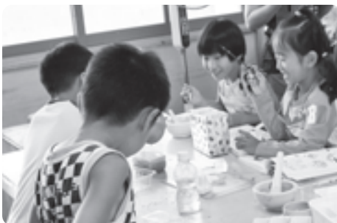
絵付け教室で楽しみながら作業をする子どもたち

同社の協力で初めて実現した企画で、子どもたちは社員から作業の手順を説明してもらい、ステンレス製の飛行機や恐竜骨格の模型作りを体験しました。