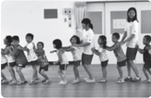
園児と一緒に遊ぶ泉ヶ丘中学校生徒 （多賀保育園）