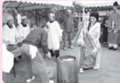
昨年の小町まつりの様子