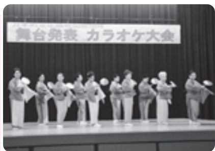
踊りを披露する 高齢者サークルの皆さん

35組約70名が出演し、美声を披露したほか、大正琴や踊りなどを発表し会場は大いに盛り上がりました。