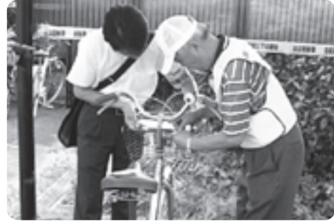
ひったくり防止には前カゴへの防止カバー装着が効果的です