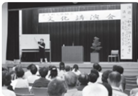
講演を熱心に聞く参加者