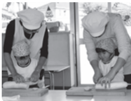
先生と一緒に大根を切る園児

様の力を浴びたお米やお野菜をバランスよく食べてみんな元気になってください。」と呼びかけました。 続いて保育園で育てた大根を使って、切干大根作りに挑戦し先生と一緒に大根を切り、ひもを通すなど作業を行いました。園児は真剣な表情でひもを通し、うまく通せたら先生に見せるなど作業に夢中になっていました。