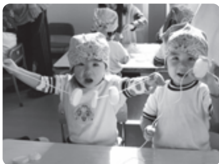
切干大根を作る園児