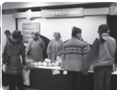
新鮮野菜は大人気でした

光パンフレットなどを配布し 井手町を紹介したほか、会場 には「いでたん」も登場し来 場者の皆さんにたくさんの方 のPRを行いました。