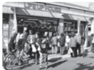
第1回百縁商店街の様子

今回は、さらに加盟店を増やし、1000円商品を数多く用意して皆様のご来場をお待ちしております。