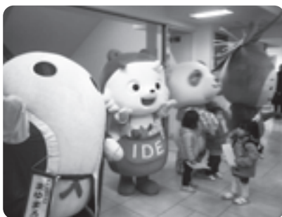
他市町村のキャラクターと 来場者を歓迎する「いでたん」