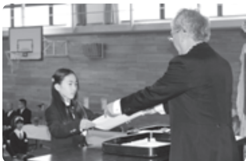
卒業証書が手渡されました(井手小)

この日、井手小学校から47名(男子25名・女子22名)、多賀小学校から19名(男子9名・女子10名)の卒業生が6年間の思い出を胸に小学校を巣立って行きました。