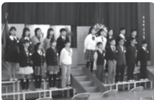
答辞を述べる卒業生(多賀小)