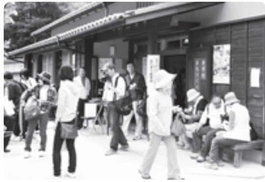
―昨年の「山背古道〜春のは〜ふウォーク」にてウォーキング客でにぎわう榎坂

●OPEN 午前9時〜午後5時 (冬季は午後4時) ●休館日 火・金曜が祝日の場合 夏季、年末年始