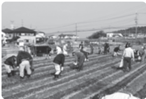
植え付け作業の様子

この事業は、高齢者生きがい対策の一環として毎年行っているもので、収穫されたじゃがいもは弥勒会や町外の福祉施設にプレゼントされる予定です。