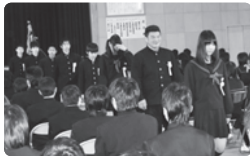
在校生に見送られる卒業生(泉ヶ丘中)

引き続き在校生代表と先生方による「構成詩」が巣立っていく卒業生に語りかけられました。