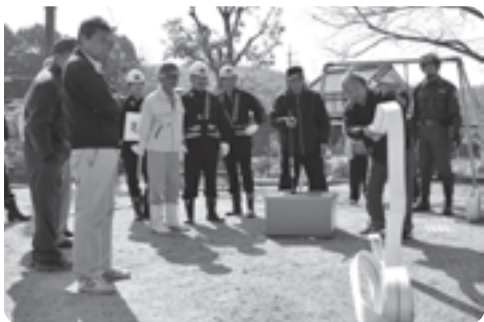
消火栓の取り扱い訓練の様子

また、起震車で大地震の揺れを体験したほか、住宅用火災警報器の啓発、非常食による炊き出し訓練などが行われました。