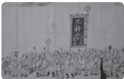
「大神宮・多賀村」の旗と、様々なかぶりもので、踊りを楽しむ人々が描かれています