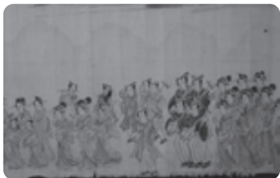
絵の後半は多くの演奏者も描かれており、演奏技術の高さを表現したものと考えられます