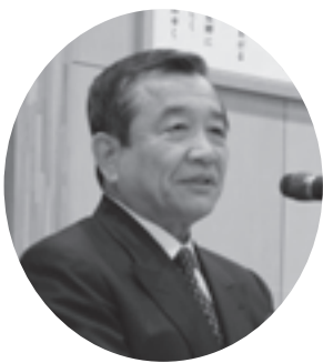
祝辞を述べる汐見町長

井手小学校前のイベント会場では、商店街のキャラクター「いでたん」が登場し人気を集めたほか、人口減少対策や地域の魅力のPRなどについて研究する京都産業大学の学生たちも模擬店を出店し、イベントの盛り上げに一役買いました。