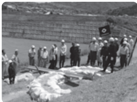
訓練の成果を視察する来賓の皆さん