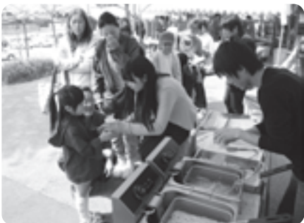
京産大の学生も模擬店で盛り上げました