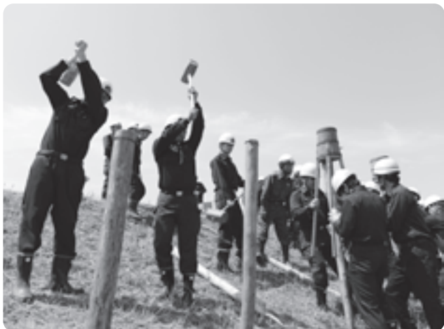
堤防補強などの工法作業に汗を流す団員の皆さん

水防訓練は、山林火災に備える消防訓練と交互に隔年で取り組んでおり、今回は団員ら総勢約200人が参加。また、より実践的な訓練効果をねらって南谷川堤防で初めての実施となりました。