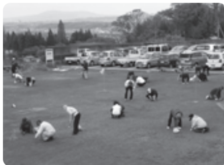
玉川砂防公園を清掃する同好会の皆さん

砂防公園は、玉川の砂防えん堤整備に伴って設けられた公園で、平成22年9月にオープンしました。芝敷きのグラウンドゴルフ場や多目的広場などが整備され、多くの人が