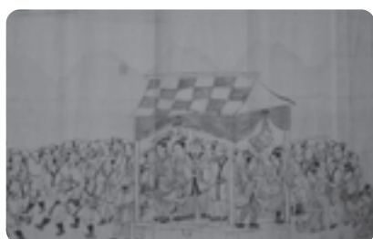
舞台が描かれてることから、伊勢参りを模して人々が集まり踊りあかしたことが伺えます