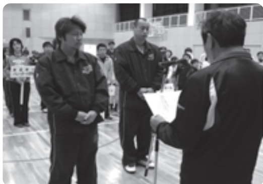
表彰を受ける選手の皆さん