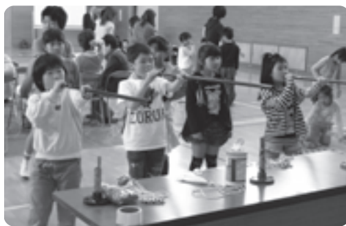
スポーツ吹き矢に挑戦する子どもたち

多賀小学校体育館で5月8日(水)、きらきりランドの開港式が行われ、参加した児童たちが、大型絵本や、ニユースポーツ、コーラスなどを楽しみました。