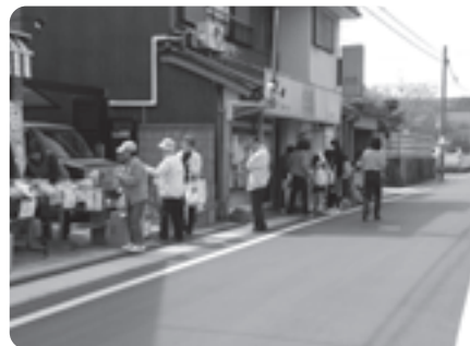
百縁商店街で掘り出し物を探す買い物客