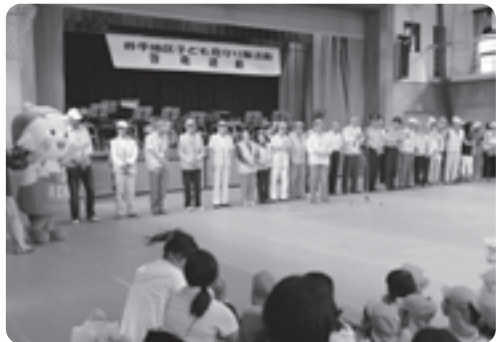
子どもたちに紹介される見守り隊の皆さん

体育館では、このあと府警音楽隊の演奏とカラーガード隊の演技が披露されたほか、グラウンドではパトカーの展示試乗や平安騎馬隊の馬への体験騎乗などが行われました。