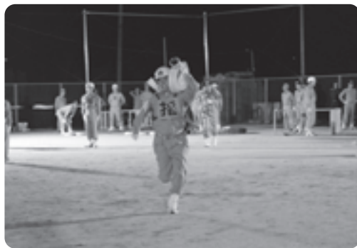
操法訓練に励む団員の皆さん

大会では、小型ポンプ操法の部に第1分団第3部、第2分団第2部が出場する予定です。訓練は、6月1日から毎週月・水・金曜日の午後8時から約2時間行われており、出場選手が消防指導員から操