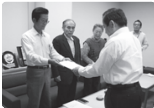
法務大臣のメッセージを手渡す推進委員会の皆さん

この運動は、犯罪や非行のない安全で安心な地域社会を築くことを目的に、犯罪や非行の防止と罪を犯した人たちの更生について地域の理解を深めようという取り組みです。推進委員会では、強調月間に合わせて街頭啓発などに取り組みます。