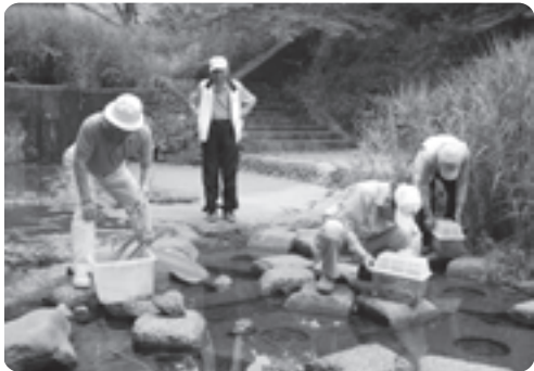
カジカガエルを放流する友の会の皆さん

玉川は「平成の名水百選」にも選ばれるなど、近年、水質も向上しており、友の会の皆さんも復元事業の推進に、ますます意欲を見せています。