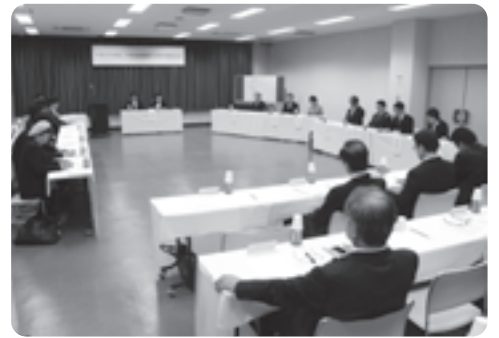
府立山城勤労者福祉会館で開かれた総会の様子

向上しましたが、12年が経つと本数の増便、ダイヤの遅れの解消など、利用者からも新たな要望が出てきます。今年8月には第一期事業に向けて基本協定に至ったことを嬉しく思うとともに、関係市町も駅舎改修やバリアフリー化、自由通路設置といった関連事業を計画しており、それらがスムーズに整備できるようJRの全面支援をお願いします」と述べるとともに、「世界に知られた観光都市を結ぶ路線にふさわしい愛称を、第一期事業の中で名付けていたたたきたい」と要望しました。