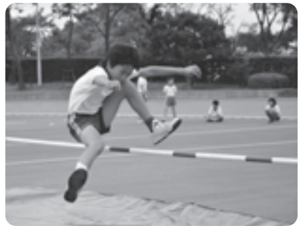
記録に挑戦する児童

井手小学校と多賀小学校の5、6年生が陸上競技で交流する井手町小学生陸上交歓記録会が10月22日（火）、府立山城総合運動公園太陽が丘の陸上競技場で行われました。