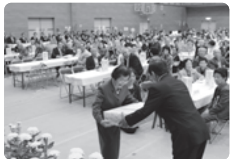
敬老祝賀式で記念品を受ける出席者の皆さん