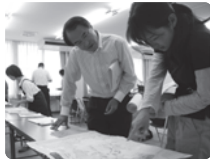
審査会で子どもたちのレポートに目を通す審査委員の皆さん

子どもたちの課題解決能力・探求力を育もうと行われている第3回井手町調べる学習コンクールの審査会が10月1日(火)、自然休養村管理センターで行われました。