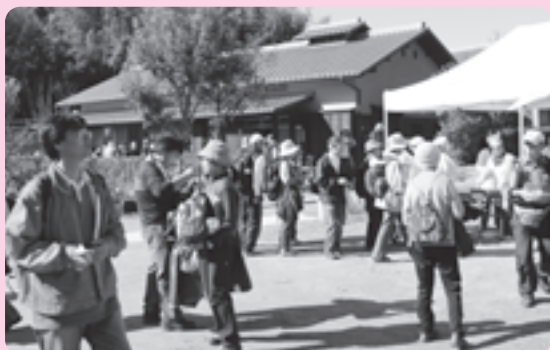
多くの参加者でにぎわう椿坂＝昨年＝