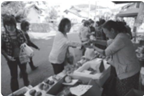
多くの人出でにぎわった第3回百縁商店街

今回は、玉川、南北石垣、多賀の3つのエリアで53店舗（団体）が参加し、食品や生活雑貨など様々な商品やサービスを100円で販売。午前10時のスタートから、各商店街は多くの買い物客などでにぎわいました。