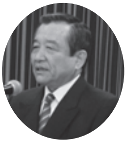
総会であいさつする汐見会長