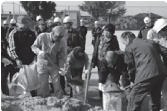
訓練に汗を流す住民の皆さん(井手小学校)

災害対策本部の設置訓練や消防団による水防活動訓練をはじめ、避難所開設や炊き出し、避難所への浸水を防ぐ土のう作りなどの訓練が各所で行われたほか、学校のプールでは、消防団員によるゴムボートを使った救助訓練などが本番さながらに繰り広げられました。