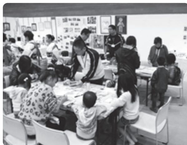
プラ板作りを楽しむ来場者