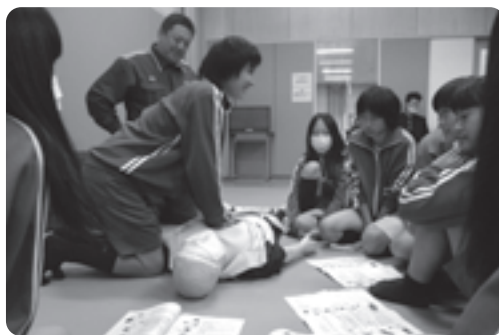
心配蘇生術を学ぶ生徒たち

心肺蘇生を体験した生徒は「簡単そうに見えましたが、実際にやってみると息切れがして疲れました。学んだ事を実践する場面があったら積極的に行動したいです」と話していました。