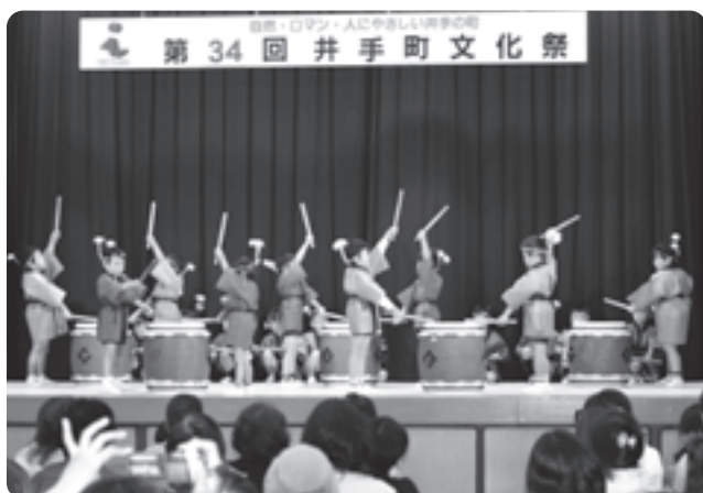
にぎやかに繰り広げられる舞台発表

また数多くの模擬店も立ち並び人気を集めるなど、会場を訪れた多くの人たちが文化の秋を堪能しました。