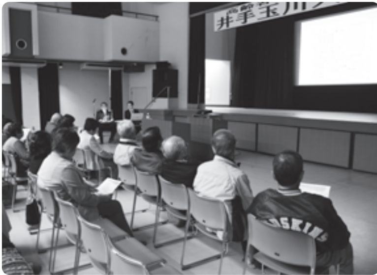
汐見町長の講演に熱心に耳を傾ける参加者の皆さん