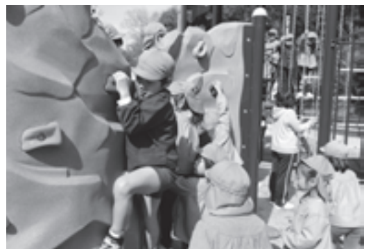
真新しい遊具に歓声を上げる子どもたち

よって河津桜も植樹いただいております、将来素晴らしい眺望になるものと期待しております」と述べました。