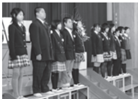
答辞を述べる卒業生たち(多賀小)