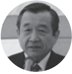
式典で式辞を述べる汐見町長

玉川さくら公園は、府道と東井手線沿いの玉川河川敷約1・4ヘクタールの敷地を、砂防施設整備に合わせて公園として整備したものです。グラウンドゴルフが楽しめる