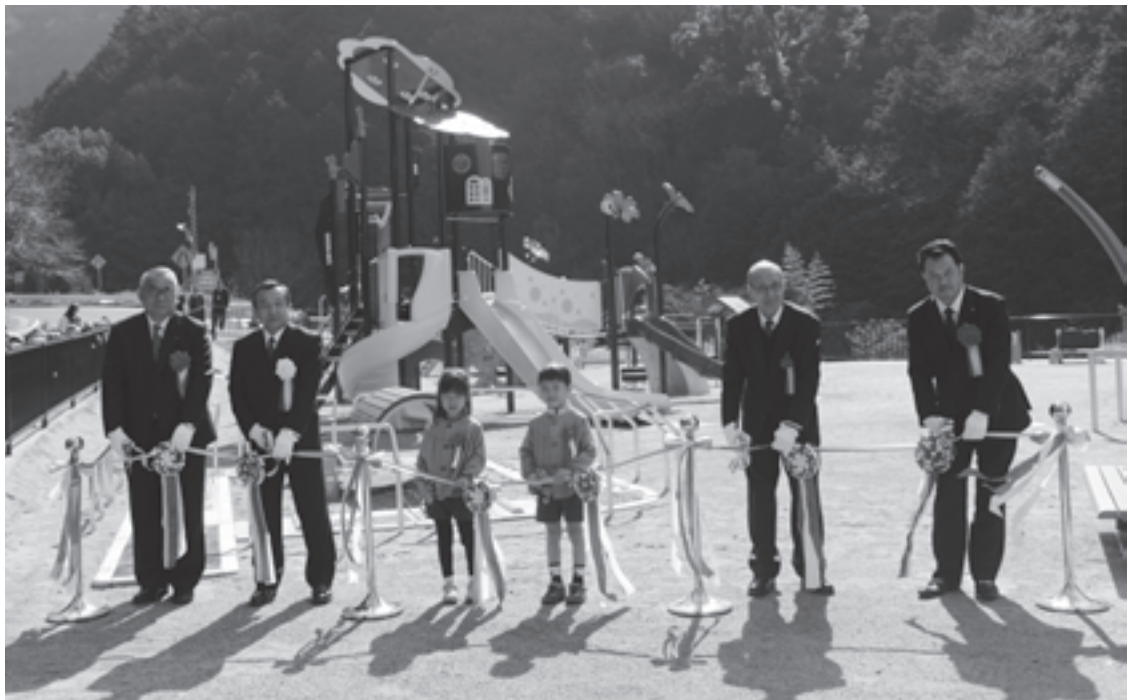
完成記念式で行われたテーブルカット

住民の皆様のご意見を反映させて府と町が連携して整備してきた経過を振り返り、「本公園は、三世代が集い親しみを