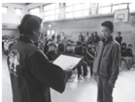
人権の花運動で感謝状を受ける児童代表