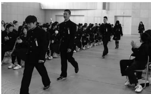
拍手に迎えられ会場に入場する新入生たち