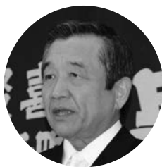
祝辞を述べる汐見町長