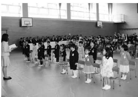
名前を呼ばれ元気に返事をする1年生（多賀小）