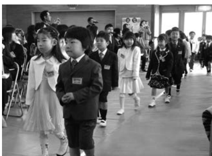
元気に入場する1年生（井手小）