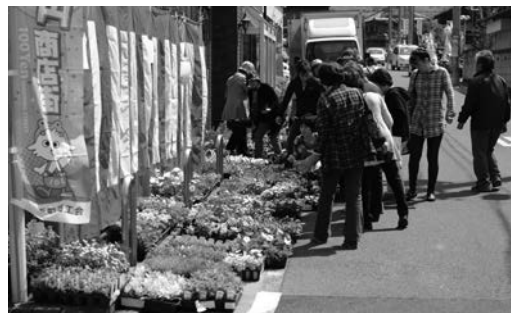
百縁商店街で掘り出し物を探す買い物客

にぎわいました。 井手小学校前の会場では、抽選会などのイベントも行われたほか、町と連携協力包括協定を結ぶ京都産業大学の学生たちによる模擬店も登場し、会場を盛り上げました。