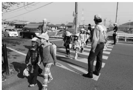
交通安全街頭指導で児童の通学を見守る皆さん

「待つゆとり ゆずるやさしさ 京の道」をスローガンに「春の全国交通安全運動」（4月6日～15日）が行われました。