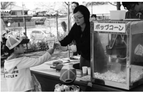
京産大の学生も模擬店で盛り上げました