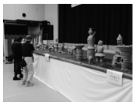
各団体の力作が展示された会場