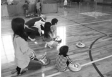
カローリングに挑戦する子どもたち

田定教育長のあいさつに続いて、バスケットボールやフットサル、カローリングなど様々なスポーツの体験コーナーが開かれ、子どもたちは思い思いの競技を楽しみました。