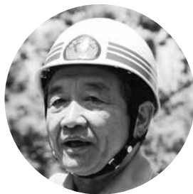
団員をねぎらう汐見町長