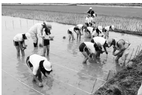
田植えに挑戦する児童たち

総合学習の時間を利用して、まちづくり教育の一環として毎年行われている活動です。秋には稲刈りにも挑戦し、収穫したお米を使った調理実習や、指導にあたった地域のボランティアの方々を招いた交流会が開かれる予定です。