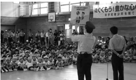
会場で行われた田辺署によるミニ講習会