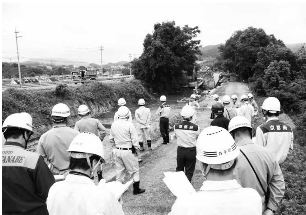
青谷川の復旧工事現場を視察するパトロール参加者

井手町は6月6日（金）、京都府や関係機関と合同で防災パトロールを行い、豪雨などによる災害発生への恐れがある危険箇所の現状や、今後の防災対策、緊急時の対応方法などを確認しました。