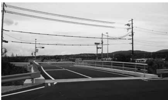
新しくなった梅溪橋

梅溪橋は、昭和39年に架けられた旧梅溪橋の老朽化に伴い、平成25年1月から架け替え工事に取り組んできました。新しい梅溪橋は、全長約20メートル、幅員約7メートル、橋上は2車線となりました。