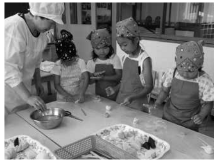
しんこだんご作りを楽しむ子どもたち

研究グループのメンバーから作り方を学びながら、ウサギやイチゴ、ブドウ、カブトムシなど思い思いの形に餅を仕上げていました。