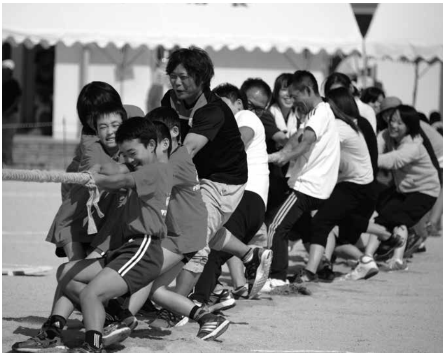
区対抗綱引きに挑む参加者の皆さん