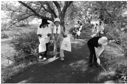
美化運動に取り組む住民の皆さん

サミ、ごみ袋などを手に、空き缶やたばこの吸い殻など、ポイ捨てされたごみや、落ち葉などを拾い集めました。この取り組みで回収されたごみは、不燃ごみ・可燃ごみを合わせて計1010キロとなりました。