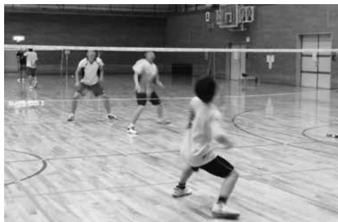
白熱のプレーを繰り広げる選手の皆さん

平成26年度の町民バドミントン大会が8月31日（日）、府立山城勤労者福祉会館で行われました。