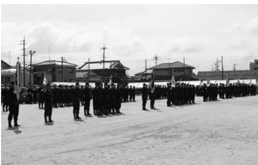
町長査閲に臨む団員の皆さん

約170人の団員が参加し、礼式訓練や小隊・中隊ごとの規律訓練をはじめ、小型ポンプ操法などを披露しました。