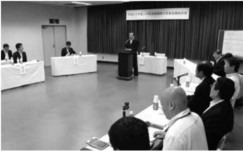
府立山城勤労者福祉会館で開かれた総会